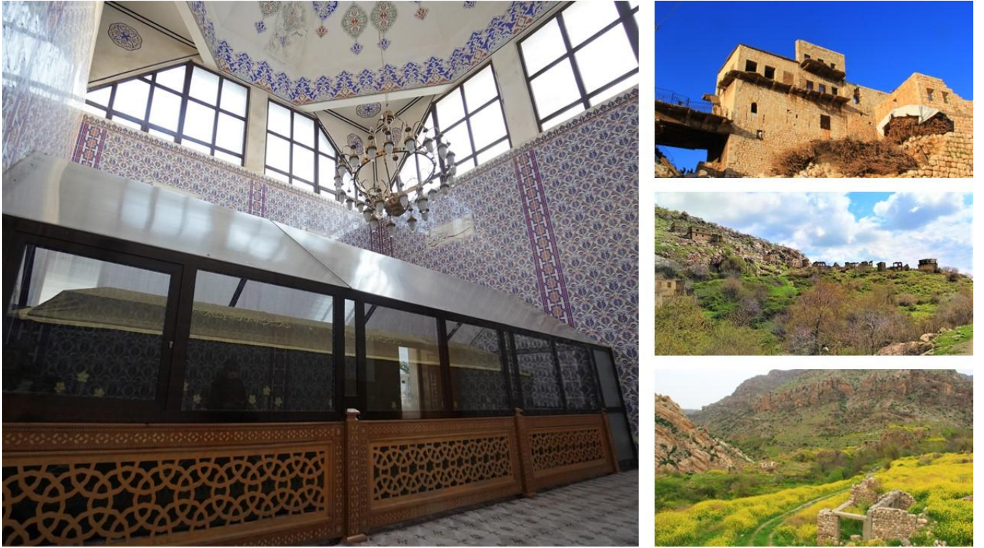
Şekil 3 : Hz. Nuh'un İzinde-Ruhun Arayışı İnanç Rotası

Bu rota Aralık, Ocak, Şubat ayları haricinde ziyaret edilebilir. Yol uzunluğu yaklaşık 149,6 km'dir. Şırnak-Cizre-Silopi-Görümlü ana yolları takip edilmektedir. Çağlayan ve Köşreli köyüne giderken yol yer yer stabilize olup, ulaşım açısından sorun yaşanmamaktadır. Ulaşım için minibüs olması tavsiye edilir. Otobüsle gelenler Sefine bölgesi için minibüs temin etmelidir. Yol boyu ilçe ve beldelerde sağlık hizmetleri alınabilir. Geçilen noktalarda telefon şebekeleri çekmektedir (Çağlayan Köyü hariç). Tasarlanan rotayla ilgili görseller Şekil'3 de verilmiştir.