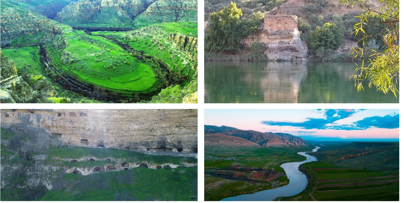
Şekil 6 : Cehennem Deresi (Newala Qoriye)-Dicle Nehri Yürüyüş Rotası

bağlı olarak kişiler rotaları kısaltabilirler. Seçeneklerden biri Yarbaşı'ndan başlayıp Cehennem Deresi Dicle Nehri Birleşme noktasından tekrar Yarbaşı köyüne dönüş, ikincisi Cehennem Deresi-Dicle Nehri Birleşme noktasından Sulak Köyü'ne gidip orda bitirmek, üçüncü seçenek Sulak Köyü'nden Elo Dino Kasrı'na yürüyüş. Dördüncü seçenek Sulak Köyü'nden Cehennem Deresi'ne gidip Yarbaşı köyüne gitmek. Beşinci seçenek Yalaz Köyünden Sulak Köyü'ne yürümek. Bu rotanın çıkışları 334 metre olup en yüksek eğimi %56,9 ortalama eğim ise %6,5 tir. Dolayısı ile zorluk derecesi 3'tür. Telefon yer yer çekmektedir. Geçilen köylerde sağlık ocağı bulunmamaktadır. Tasarlanan rotayla ilgili görseller Şekil'6 da verilmiştir.