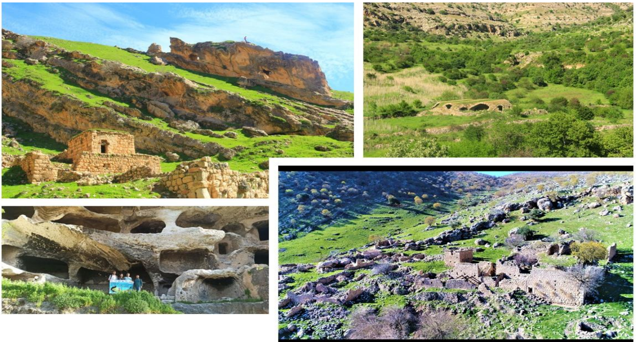
Şekil 5: Anabasis-Onbinlerin Dönüşü Yürüyüş Rotası

Bu rota ' Anabasis-Onbinlerin Dönüşü Yürüyüş Rotası ' olarak adlandırılmıştır. Xenofon'un Onbinlerin Dönüşü'nde orduların en fazla zorlandıkları yerlerden biri Dicle Nehri'dir. Dicle Nehrinde Kardukh'luların Yunan askerlerine saldırılarına Ksefenon canlı şahitlik etmiştir. Bundan dolayı bu rotaya uluslararası bilinirliği olan Anabasis adı verilmiştir. Bu yolda aynı zamanda mirlerin yazlığı olarak ve krallar geçidi olarak bilinen Kasrik Geçiti bunun yanında Feqiye Teyran Medresesi, Finik Ören Yeri, Timur'un Pençeleri ve Asur yerleşim yerleri rotaya eklenmiştir. Bu rota dört farklı etaptan oluşmaktadır. Her bir etabın kendisine has doğası ve tarihi dokusu bulunmaktadır. Tasarlanan rotayla ilgili görseller Şekil'5 te verilmiştir.