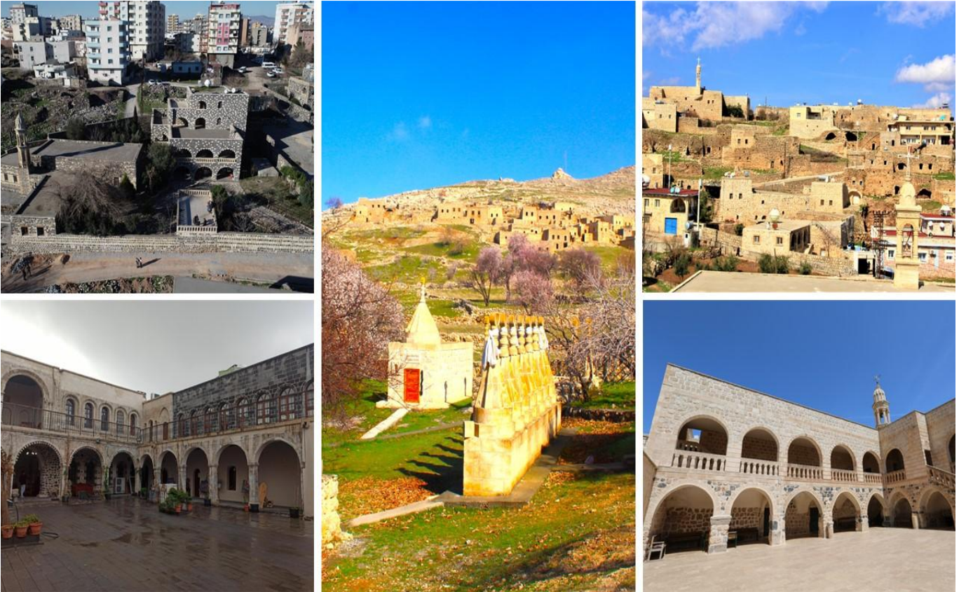
Şekil 2. Beyt-Zabde Kültür ve İnanç Rotası

Oluşturulan rotaların ilki Beyt-Zabde Kültür ve İnanç Rotası olarak adlandırılmıştır. Tarihte Dicle'nin batısında olan İdil ve Cizre çevresine Beyt-Zabde (Tüzün, 2019) denilmiştir., İpek yolu üzerinde olan İdil ve Cizre ilçelerini kapsamaktadır. Bu rota kapsamında ilk durak eski bir Ezidi yerleşimi olan Kiwax/Mağara Köyüdür. Bu köyde tarihi evlerin mağaradan yapıldığı veya mağara ile bağlantısının olduğu görülmektedir. Mevcut durumda kimse bu köyde yaşamamaktadır. Mağara Köyü, farklı mezar yapıları ve taş evleri ile gelenleri büyüleyen mistik bir hava sunmaktadır. Mağara Köyünden sonra Süryani halkının yaşadığı Sare, Ögündük ve Haberli köyleri ve bu köylerde bulunan kiliseler (sırayla: Mor Melke, Mor Yakup, Mor Dodo vs.) ziyaret edilmektedir. İdil Merkez' de bulunan tarihi Meryem Ana Kilisesine doğru gidilmektedir. Rotanın İdil etabından sonra Cizre'ye gidilerek Hz. Nuh Türbesi, Kırmızı Medrese, Ulu Camii, Mem û Zin Türbesi, Abdaliye Medresesi, Cizre Kalesi, Cizre Surları (Bırca Belek), Mirlerin Bahçesi (Raze Mira), Tarihi Çarşı ve Dicle Nehri rotada yer almaktadır. Bu rota yılın 4 mevsiminde gezilip görülebilir. Yol mesafesi köylere giriş çıkış ile yaklaşık 96,4 km'dir. Yol durumu asfalttır. Her türlü otomobil, minibüs, otobüs vs. türü araçlarla gidilebilir. Rota boyunca telefonlar çekmekte, sağlık kurumları bulunmaktadır. Tasarlanan rotayla ilgili görseller Şekil'2 de verilmiştir.