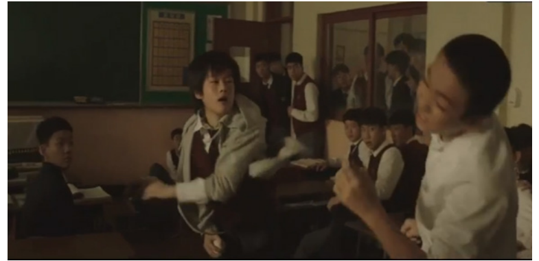
Resim 11. 5. Bölümde Gösterilen Savunucu Rolü

Dizinin 5. Bölümünde, sınıfında yaşanan zorbalığa bir süre sessiz kaldıktan sonra zorbalığın en şiddetlendiği bir anda zorba öğrencilere saldırarak bu zorbalığı önlemek isteyen bir savunucu ortaya çıkmıştır. Savunucu zorbalığa maruz kalan asıl mağdur öğrencilere saldırılan bir esnada onlara tepki olarak tekme ve