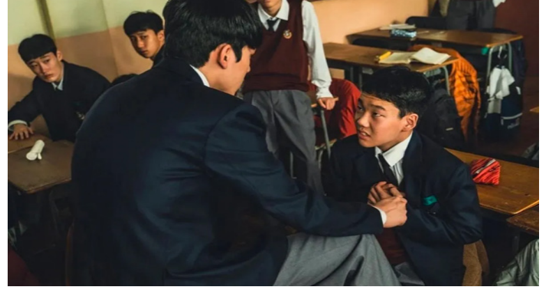
Resim 7. 3. Bölümde Gösterilen Akran Zorbalıklarında Zorba ve Mağdur Rolü

Akran zorbalığının ortaya çıkmasına sebep olan ve bu zorbalıkları sürdüren zorbalar, genellikle saldırgan davranışlar sergileyen ve etrafa korku salan kişilerdir. Zorbalar çoğu zaman mağdurlardan farklı olarak onları üstün gösteren özelliklere sahiptir. Bu dizi içerisinde zorbalık uygulayan kişi zengin bir aileye sahip olmakla birlikte aynı zamanda sınıf başkanıdır. Bu yetkisinin ve ailesinin güvencesine dayanarak kendisinden aşağı olarak gördüğü birçok öğrenciye zorbalık uygulamaktan çekinmemektedir. Mağdur kişi zorbaya nazaran daha güçsüz ve zorbanın bulunduğu konumdan daha alt bir konumda yer alır. Bu nedenlerden kaynaklı olarak mağdur kişi kendisini güçsüz kabul eder ve zorbalığa maruz kalmaya göz yummaktadır.