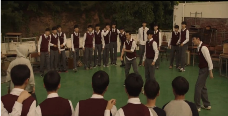
Resim 9. 10. Bölümde Gösterilen Akran Zorbalıklarında Destekleyicilerin ve İzleyicilerin Rolü

Destekleyiciler ve izleyiciler genellikle zorbalık dışında kalan kişilerdir. Bu kişiler etraflarında yaşanan zorbalığı görürler ancak bu zorbalığa müdahale etmek yerine sadece kenardan izlemeyi tercih ederler. Destekleyicilerin izleyicilerden farkı, var olan zorbalığın devam etmesini sağlayacak tepkiler göstermeleridir. Zorbalıların hareketlerini onaylayarak ya da zorbayı mağdura karşı daha da cesaretlendirerek zorbalığın