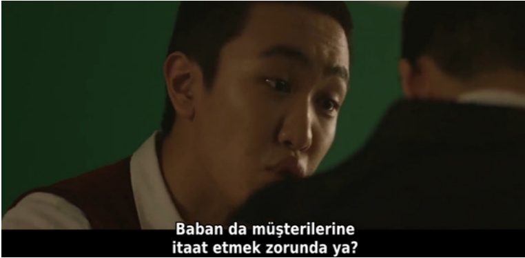
Resim 4: 2. Bölümde Gösterilen Sosyo-Ekonomik Bir Olgu Olarak Ortaya Çıkan Zorbalık

Akran zorbalığını ortaya çıkaran beş temel kuramsal yaklaşımdan biri olan ‘sosyo-ekonomik bir olgu olarak zorbalık’ bu dizi içerisinde akran zorbalığını ortaya çıkaran başlıca nedenlerden birini oluşturmaktadır. Dizide mağdur olan öğrencinin babasının yaptığı iş onun diğer öğrencilere karşı sınıfsal olarak ayırım yaşamasına sebebiyet vermektedir. 2. Bölüm içerisinde gösterilen bu sahnede de mağdurun babasının yaptığı işe gönderme yapılarak mağdur üzerinde bir baskı kurulmuş ve zorba davranışlar sergilenmiştir. Dizi içerisinde mağdurun yakın arkadaşı olarak gösterilen Jong-Suk da arkadaşına yapılan zorbalığa ses çıkardığı için ve aile mesleklerinin balıkçılık olmasından kaynaklı olarak zorbalığa uğramaktadır. Dizi genel olarak zorba davranışların bir sınıf ayırımından