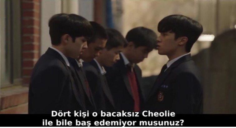
Resim 6. 8. Bölümde Gösterilen Akran Zorbalığına Bağlı Olarak Ortaya Çıkan Zorbalık

Dizide zorbalık yapan zorba öğrencilerin, başlarını okul temsilcilerinin oluşturduğu ve kendi üst sınıfları olan kişiler tarafından zorbalığa uğradıkları gösterilmektedir. Zorba davranışlar sergileyen öğrencilerin kendi aralarında oluşturdukları gruplar içerisinde yer almak amacıyla üst sınıfların zorba davranışlarına maruz kalarak onlar da kendilerinden aşağı gördükleri öğrencilere zorbalık yapmaktadır. Bunu ait oldukları akran grubunun kurallarına ve isteklerine uygun davranmak için yapmaktadırlar. Gördükleri akran zorbalığına bağlı olarak yaptıkları zorba davranışlar gruba aidiyet duygusundan ve kendilerini zorbalığa maruz kalmaktan kurtarmak için ortaya çıkmaktadır. Bu açıdan bakıldığında akran zorbalığını ortaya çıkaran beş kuramdan biri olan 'okuldaki akran zorbalığına bağlı olarak ortaya çıkan zorbalık' kuramı dizide zorbalığa neden olan bir örnek olarak yansıtılmıştır.