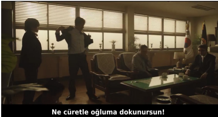
Resim 12. 7. Bölümde Gösterilen Zorbanın Babası Tarafından Savunucuya Karşı Uygulanan Şiddet