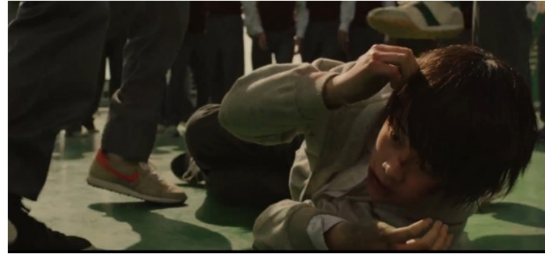
Resim 10. 10. Bölümde Gösterilen Destekçilerin Zorbalığa Katılımı

Okul terasında gerçekleşen zorbalığın devamında mağdur öğrenci kendisini savunamayacak duruma düşmektedir. Bu öğrencinin savunmasız duruma düştüğünü gören destekleyicilerin de zorbalığa dahil oldukları görülmektedir.