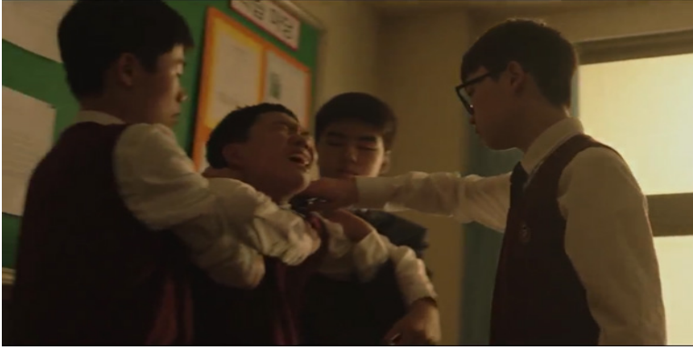
Resim 8. 8. Bölümde Gösterilen Akran Zorbalıklarında Yardımcıların Rolü

Akran zorbalığının başlamasında etkin olmayan ancak zorbalık başladıktan sonra genellikle zorbalıların sözünü dinleyen yardımcıları, zorbalıların tarafında olan kişilerdir. Dizi içerisinde gösterilen bu sahnede yardımcıları zorbalıların kendilerinden istedikleri gibi mağduru savunmasız bir hale getirmeyi amaçlayarak zorbanın mağdura daha rahat bir şekilde zorbalık yapmasını sağlarlar. Akran zorbalığında yer alan yardımcıları bu davranışı genellikle zorba kişilerden ayrı bir zorbalık görmemek amacıyla sergileyerek zorbalıların her istediklerini yerine getirmeye çalışan kişilerdir. Yardımcıları, mevcut olan zorbalığın son bulmasına engel olan faktörlerden birini oluşturmaktadır.