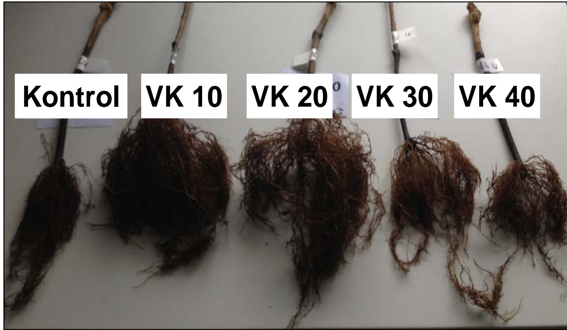
Şekil 3. Asma fidanlarının kök görünüşleri