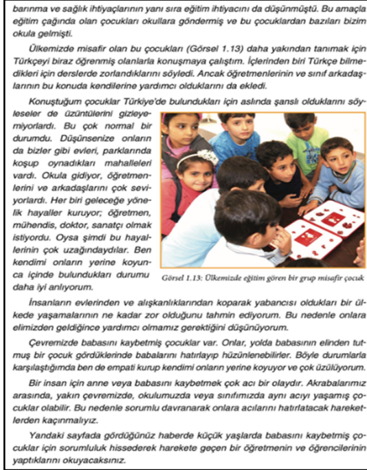
Şekil 1. 4. Sınıf SBDK s.26

4. sınıf SBDK birlikte yaşama kültürü bağlamında incelendiğinde birlikte yaşama kültürünü doğrudan ön plana çıkaran birçok içerik tespit edilmiştir. Ayrıca içeriklerin çoğu kök değerlerden hareketle birlikte yaşama kültürünü kazandırabilecek muhtevaya sahiptir. İçeriklere ait şekiller aşağıda verilmiştir.