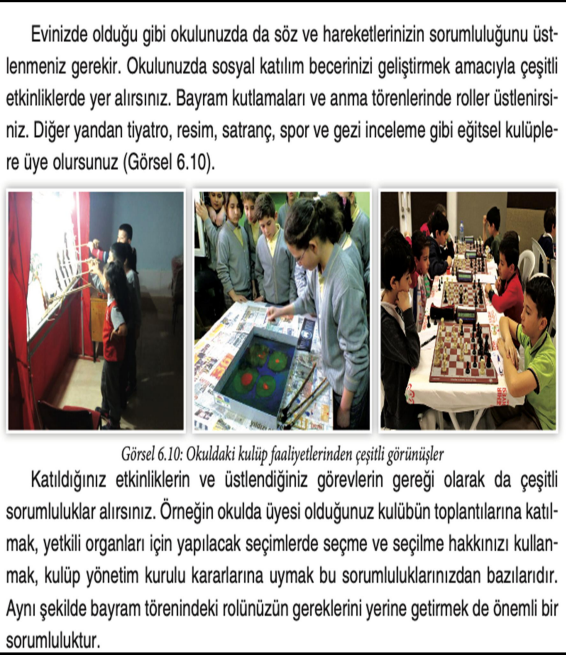
Şekil 5. 4. Sınıf SBDK s.160

Şekil 5 ve 6'da bireylerin haklarının ve özgürlüklerinin sınırsız olmadığı, herkesin sorumluluk bilinciyle hareket ederek birlikte yaşayabileceği vurgulanmaktadır.