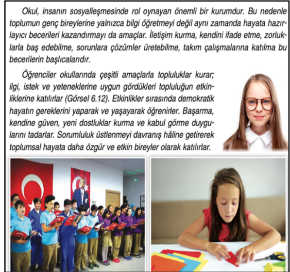
Şekil 8. 4. Sınıf SBDK s.163

Şekil 7'de bir köy okuluyla kardeş okul projesi yapan öğrencilerden bahsedilmiştir. Köy okuluna yardım etmek amacıyla kermes düzenledikleri, yeni tanıdıkları arkadaşlarıyla sevgi ve kardeşlik bağları içinde güzel zaman geçirdikleri vurgulanmıştır.