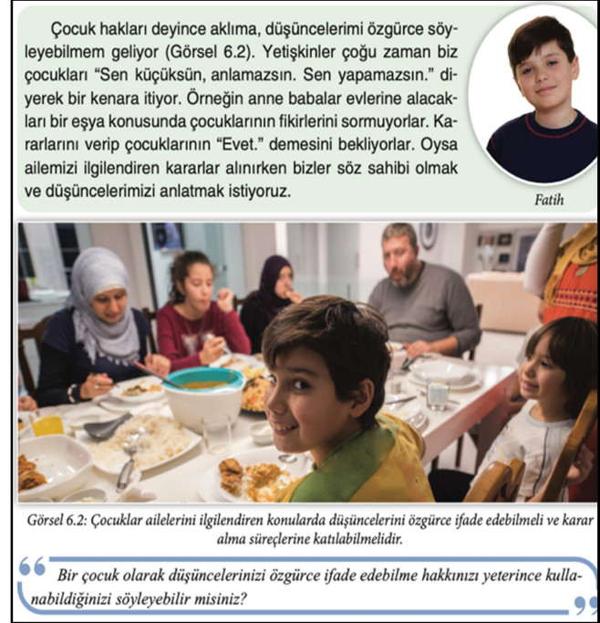
Şekil 2. 4. Sınıf SBDK s.154

Şekil 1'de görüleceği üzere ülkemize çeşitli sebeplerden dolayı sığınan çocukların yaşadıkları sıkıntılardan bahsedilerek empati yapmamız ve onlara destek olmamız gerektiği bahsedilerek, onları incitecek hareketlerden kaçınılması öğütlenmiştir.