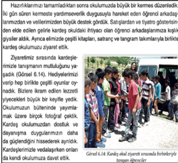
Şekil 7. 4. Sınıf SBDK s.165