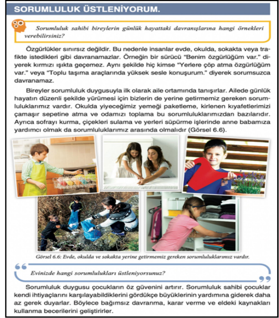
Şekil 6. 4. Sınıf SBDK s.157

Şekil 5 ve 6'da bireylerin haklarının ve özgürlüklerinin sınırsız olmadığı, herkesin sorumluluk bilinciyle hareket ederek birlikte yaşayabileceği vurgulanmaktadır.