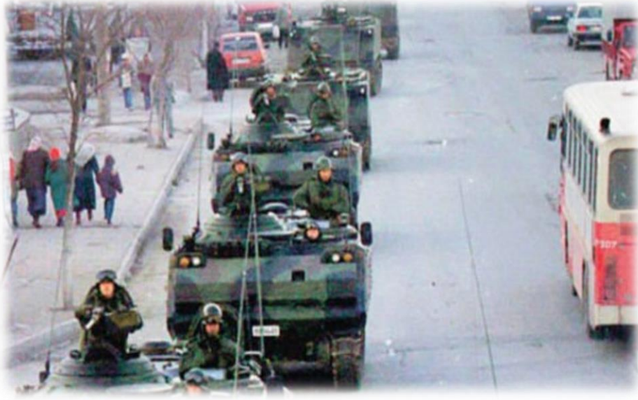
Resim 2. 28 Şubat askeri müdahalede ordunun halka karışması

Cumhuriyet Gazetesi yazarı Uğur Mumcu'nun 24 Ocak 1993 de katli ve bunun, İBDA-C tarafından üstlenilmesiyle, Mumcu'nun cenaze merasiminde “Kahrolsun Şeriat, Türkiye İnan olmayacak” biçiminde atılan sloganların neticesinde ülke genelinde, “Laik/Anti-laik” zıtlaşmasını daha da derinleşmesine sebep olmuştur. 8. Cumhurbaşkanı Turgut Özal'ın beş ülkede 12 günlük Orta Asya gezisi sonrası 17 Nisan 1993'te ansızın ölmesinin (Öcal, 2009, s. 15) akabinde TBMM'de 16 Mayıs 1993'te yapılan Cumhurbaşkanlığı seçiminin üçüncü turunda 244 oy alan Demirel, 9. Cumhurbaşkanı olmaya hak kazanmıştır. Sonrasında Tansu Çiller, DYP Genel Başkanı seçilmiş ve Başbakan Çiller önderliğinde 1'inci Çiller Hükümeti, olarak bilinen 50'nci Hükümeti, 25 Haziran 1993'te kurulmuştur (Meclis Araştırması Komisyonu Raporu, 2012).