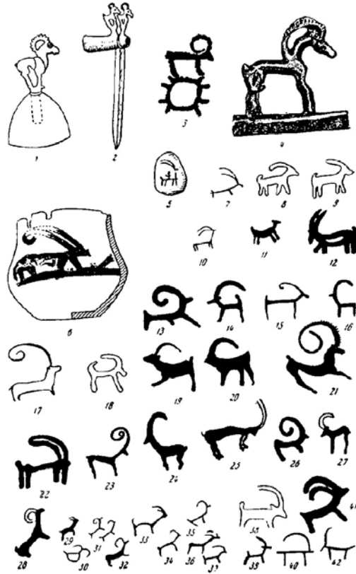
Resim 2: M. H. Mannay-ool'un tablosu (S. A. 1967, No: 1)

Aynı kayanın yüzeyinde farklı dönemlerde yapılmış petrogliflerin bulunması, şaşılacak bir şey değildir 57 . Bunu merkezî Asya'nın kabirleri gibi arkeolojik anıtlar için de söylemek mümkündür.