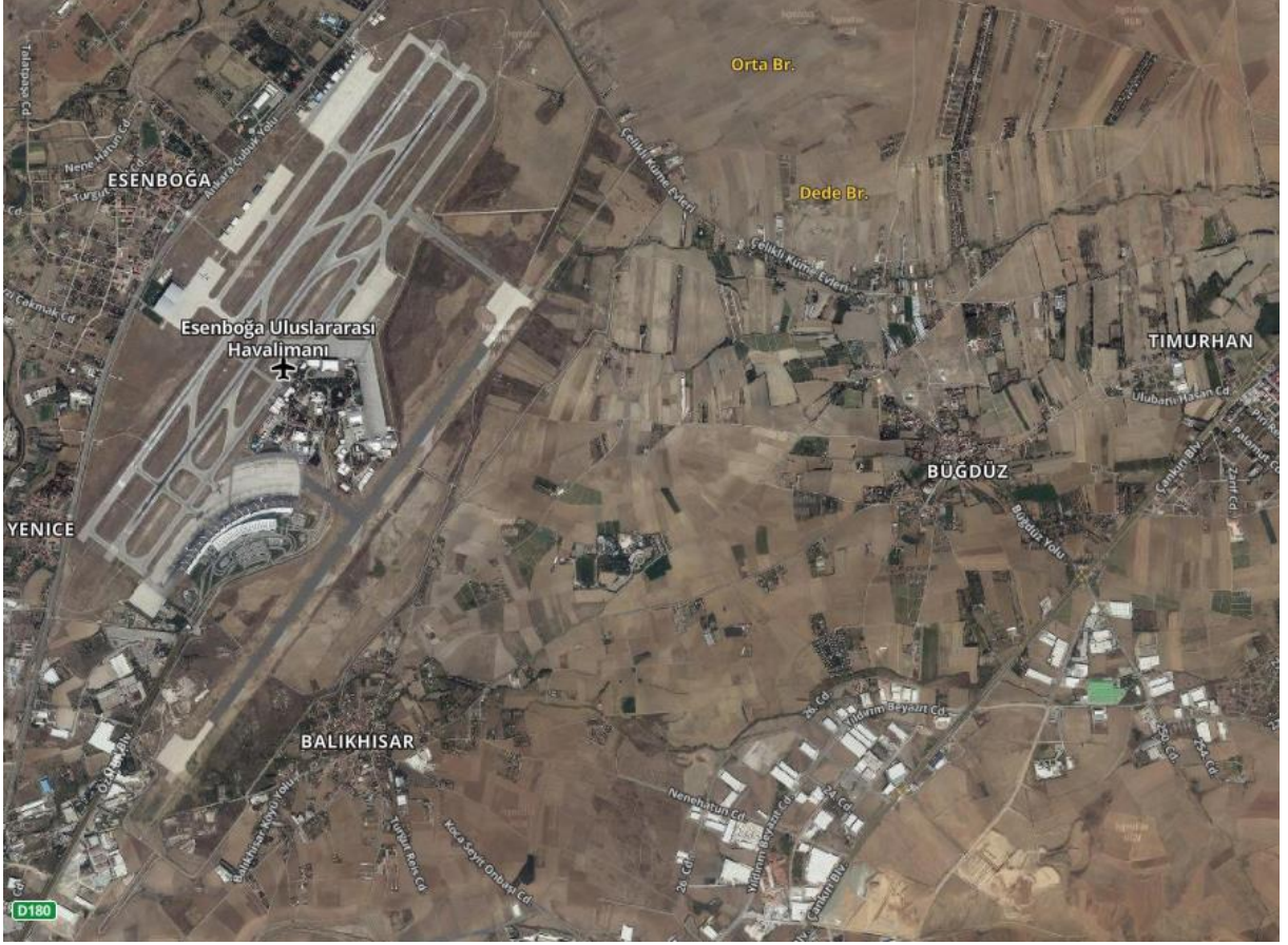
Harita 3. Balıkhisarı ve civarı. (Atlas, Harita Genel Müdürlüğü.

https://atlas.harita.gov.tr/#12.7/40.12564/33.04088 )