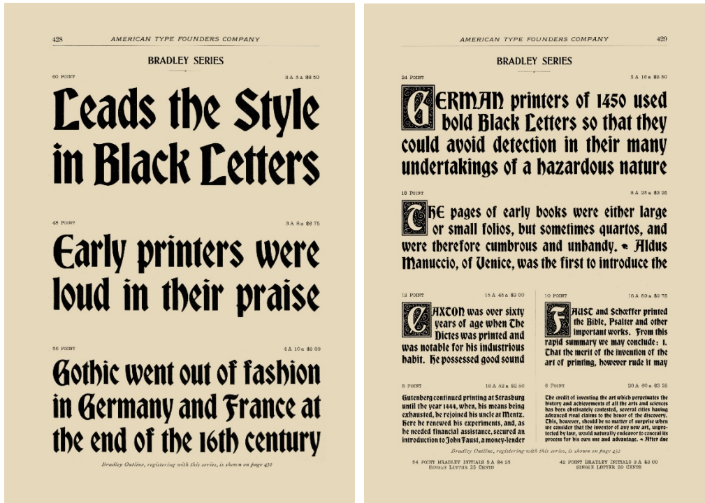
Resim 10. Desk Book of Type, 1899, Bradley Series, 'Bradley Serisi' yazı tipinin 60pt, 48pt ve 36pt boyutlu örnekleri, S. 428-429.

Başarısının bir göstergesi olarak, Bradley Serisi kısa süre sonra Amerika'daki ve yurt dışındaki birçok dökümhane tarafından kopyalanmıştır.