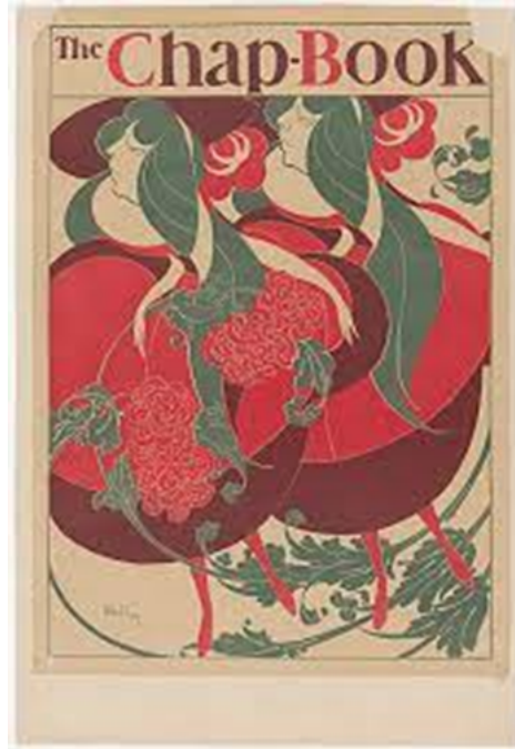
Resim 8. William Henry Bradley, The Chap-Book: The Twins (İkizler) , 1894, Baskı, 50,8 x 35,6 cm, Metropolitan Müzesi, Amerika Birleşik Devletleri

Bradley, 1868'de Boston, Massachusetts'te doğmuştur. Genç yaşta sanatla ilgilenmeye başlamış ve 1886'da Massachusetts Güzel Sanatlar Akademisi'ne girmiştir. Akademiden önce Bradley, Chicago merkezli kısa ömürlü ama önemli bir yayın olan The Chap-Book 'u tanıtmak için bir dizi tasarım gerçekleştirmiştir. The Twins adlı Chap-Book için 1894 tasarımı, ilk Amerikan Art Nouveau posteri olarak anıldı; dergi için bu ve diğer afişler, ona yaygın bir tanınma ve popülerlik kazandırmıştır (www.metmuseum.org, 2023).