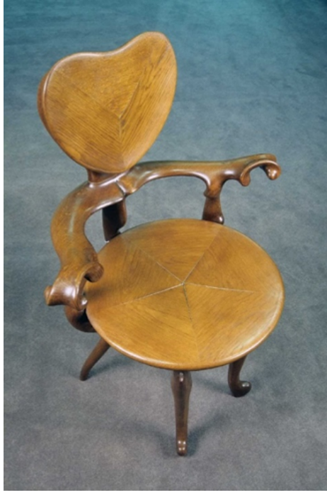
Resim 3. Antoni Gaudí, Sillón Calvet , 1966, 20.5 x 37 x 23.25, Mobilya, İspanya

Sentetik Sanat ve El Sanatları: Art Nouveau hareketi, el sanatlarını ve zanaatları önemseyen bir yaklaşım sergilemiştir. Bu akım altında üretilen eserlerde, sanatçılar ve tasarımcılar el emeği ve özeni yansıtan detaylara büyük önem vermişlerdir. Bu, sanatın endüstriyelleşmenin etkilerinden uzaklaşmasını ve özgünlüğünü korumasını amaçlamıştır.