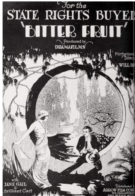
Resim 13. Will H. Bradley, Bitter Fruit (Acı Meyve), Ekim 1920, Film Afışı, Amerika Birleşik Devletleri

Sonrasında, American Type Founders için danışman olarak görev aldı ve Collier's Weekly için editör olarak çalışmıştır. Bir süre çocuk kitaplarıyla ilgilendikten sonra, Wharton Brothers'ın Beatrice Fairfax (1916) ve Patria (1917) adlı seri filmlerinde William Randolph Hearst'ün film bölümünde denetleyici sanat yönetmeni ve yönetmen yardımcısı olarak görev yapmıştır (Artvee, 2023).