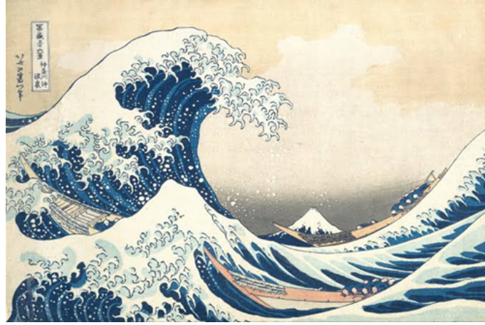
Resim 1. Katsushika Hokusai, Under the Wave off Kanagawa , 1830–32, Baskı, 25,7 x 37,9 cm, Metropolitan Sanat Müzesi, Japonya

"The Great Wave off Kanagawa" (Kanagawa'dan Büyük Dalga), Japon sanatçı Katsushika Hokusai tarafından 1829-1833 yılları arasında Tokyo'da yapılmış bir Japon baskısıdır. Bu baskı, Japon Art Nouveau hareketinin en ünlü eserlerinden biridir.