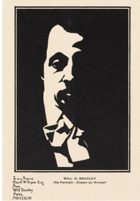
Resim 6. Will H. Bradley, Otoportre, Mart 1896, 29 x 22 cm, Boston, İngiltere

Will H. Bradley (10 Temmuz 1868- 25 Ocak 1962), Amerika Birleşik Devletleri'nde Art Nouveau hareketinin en önemli grafik sanatçılarından biridir. Bradley, afişler, kitap kapakları, illüstrasyonlar ve reklamlar da dahil olmak üzere çeşitli ortamlarda çalışmıştır. Eserleri, kıvrımlı çizgileri, canlı renkleri ve dekoratif motifleriyle karakterizedir. Babasının vefatından sonra, on iki yaşında olan Bradley, annesinin 1874 yılında taşındığı Michigan'daki Ishpeming'deki bir matbaa dükkânında çalışmaya başlamıştır. Bu iş deneyimi, Bradley'yi gelecek yıllarda ilgileneceği dizgi, reklam ve düzenleme gibi pek çok konuyla tanıştırma açısından önem taşımıştır. (Americanart, 2023).