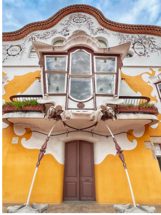
Resim 2. Josep Maria Jujol, Can Negre, 1915-1930, Barselona, İspanya

Organik Hatlar ve Kıvrımlar: Art Nouveau'nun belirgin bir özelliği, binalar, mobilyalar, takılar ve diğer tasarımlarda görülen kıvrımlı ve akıcı hatlardır. Bu hatlar, doğanın akışkanlığını, büyümesini ve dönüşümünü yansıtır. Organik hatlar ve kıvrımlar, sert geometrik formların yerine daha doğal, organik bir estetik sunarak farklılık oluşturmuştur. Bu tarzda hazırlanmış bir mobilya olarak: Antoni Gaudí tarafından tasarlanmış Sillón Calvet'i örnek göstermek mümkündür.