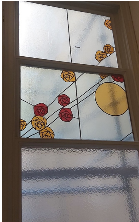
Resim 5. Casa Botter içinden bir görünüm, 1900-1901, Vitray, İstanbul, Türkiye

Bu apartman diğer birçok yapı gibi 20. yüzyılda Avrupa etkisiyle inşa edilmiştir. Aynı akımda el yapımı sanatsal detaylar büyük önem taşımaktadır. Akım, el işçiliği ve sanatsal detayların önemini vurgular. El emeği ve sanatçının özgün dokunuşu, tasarımların değerini artırır. Bu detaylarda tahta, cam, beton gibi birçok malzeme kullanılabilir. Örnek olarak Resim 5'te Casa Botter Apartmanı'nın iç kısmında yer alan camlarda el işçiliği ile yapılan vitray camlar buna örnek olarak gösterilebilir. Tasarım alanında, Art Nouveau sanatçıları yeni malzemeler ve teknikler keşfetmişlerdir. Cam, demir, seramik gibi malzemelerle tasarımlarını zenginleştirmişlerdir.