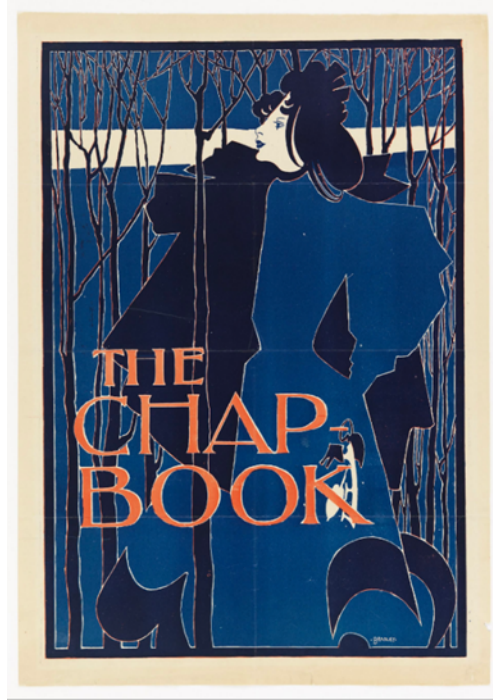
Resim 12. William Bradley, The Chap Book (Bölüm Kitabı), 1894, Taşbaskı, 47,7x33 cm, MoMa, Amerika Birleşik Devletleri

Sonrasında, American Type Founders için danışman olarak görev aldı ve Collier's Weekly için editör olarak çalışmıştır. Bir süre çocuk kitaplarıyla ilgilendikten sonra, Wharton Brothers'ın Beatrice Fairfax (1916) ve Patria (1917) adlı seri filmlerinde William Randolph Hearst'ün film bölümünde denetleyici sanat yönetmeni ve yönetmen yardımcısı olarak görev yapmıştır (Artvee, 2023).