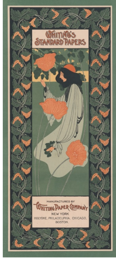
Resim 11. Will Bradley, Whiting's ledger papers (Whiting'in defter belgeleri), 1895, Taşbaskı, 50.4 × 23.4 cm, Metropolitan Müzesi, Amerika Birleşik Devletleri

1895 yılında Bradley, Massachusetts'in Springfield şehrinde Wayside Press adlı matbaayı kurdu ve aylık bir sanat dergisi olan "Bradley: His Book"u yayınlamıştır. Uzun ömrünün geri kalan kısmında, grafik sanatlar dünyasının etkin ve önde gelen bir üyesi olarak faaliyet göstermeye devam etmiştir.