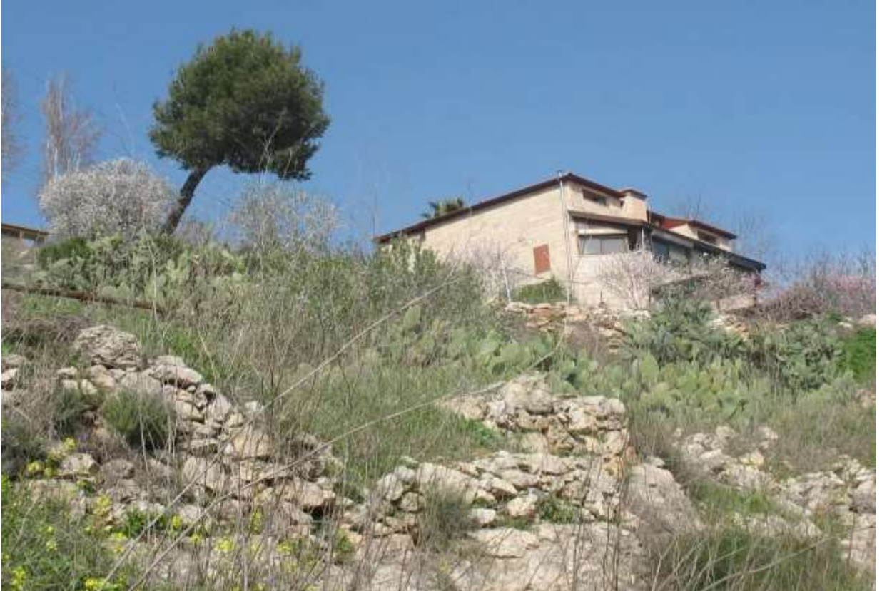
Resim 2: Bir Filistin köyü olan Kalunya'nın kalıntıları ve üzerindeki Yahudi yerleşimi ( https://www.palestineremembered.com/tags/Home-Destruction-&-Rubble.html )