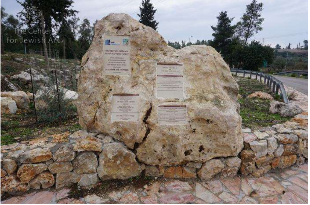
Resim 1: Holokost'ta öldürülen altı milyon Yahudi anısına, yıkılan veya yakılan Filistin köylerinin enkazı üzerine 1951 yılında JNF tarafından altı milyon ağaç dikilerek yapılan Şehitler Ormanı'ndaki anıt. ( https://cja.huji.ac.il/hmm/browser.php?mode=alone&id=395191 )