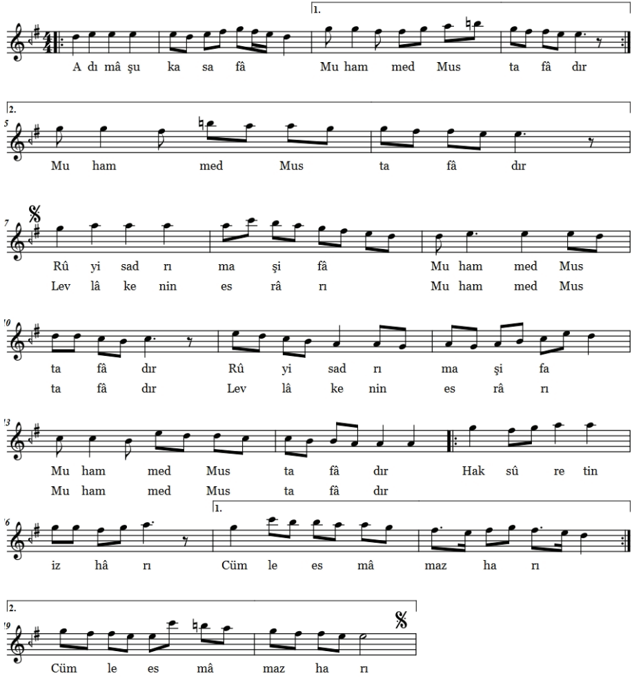
Şekil 22. Hüseyinî İlâhi (Adı Mâşûka Safâ)

Güfte:Mehmet Birgül Beste:Fatih Karaca Kaynak Kişi:Ramazan Söyler Notaya Alan:Mustafa Asım Akkuş