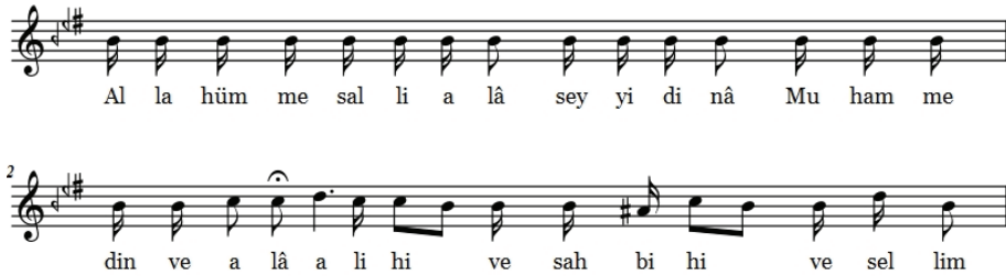
Şekil 8. Segâh Salâvât

Kaynak Kişi:Ramazan Söyler Derleyen:Mustafa Asım Akkuş