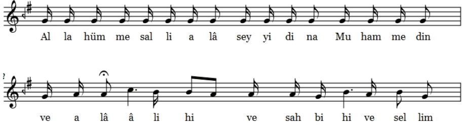
Şekil 6. Rast Salâvât