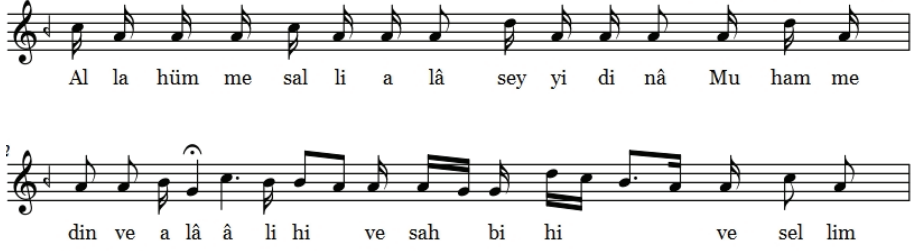
Şekil 7. Uşşak Salâvât

Kaynak Kişi:Ramazan Söyler Derleyen:Mustafa Asım Akkuş