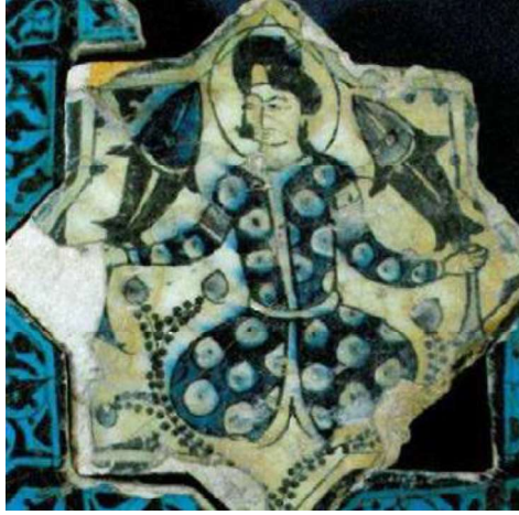
Görsel.10. Balık Tutan Adam

Çoğunlukla bağdaş kurmuş figürlere rastlanır. Kubadabad sarayı çinilerindeki figürler “Türk Oturuşu” adı verilen oturuş ile yansımıştır. Bu oturuşta figürler cepheden resmedilmiştir. Bazılarının ellerindeki kadehler dünya egemenliğini, hayat suyunu, cenneti ve ölümsüzlüğü simgeler. Ellerinde balık tutan figürlerin ellerindeki balık bolluk ve bereketi, ellerinde tuttıkları haşhaş ve nar ağacı gibi bitkisel motifler de sonsuz yaşamı simgeler (Paşabahçe Katalog, s.8).