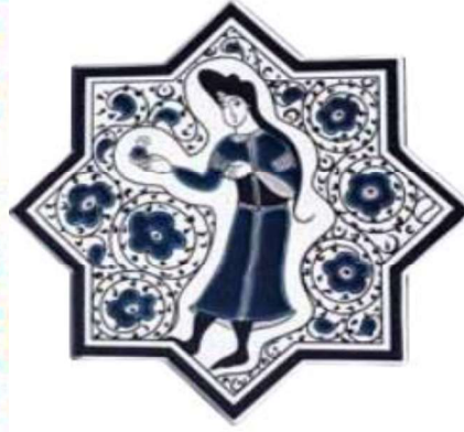
Görsel.13. Paşabahçe kristalin Çiniler