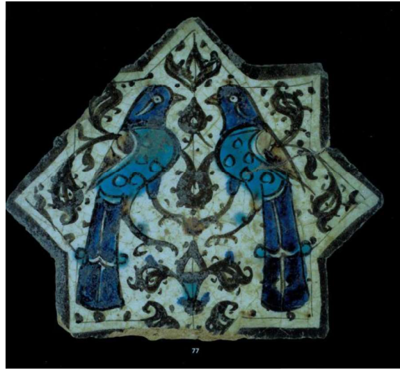
Görsel.4. Kuş Figürü

Kutsal saydıkları kartal figürünü sultan ile bağdaştırmışlardır. Hem sultana hem de kartala aynı anlamı yüklemişlerdir. Bu sebeple kartal figürlerinin bazılarının gövdelerinde Es-Sultan yazmaktadır. Kendileri için önemli olan bir diğer hayvan ise kuştur. Orta Asya'da kuşun, ölümden sonra insanların ruhlarını cennete ulaştırdığına dair olan inanış Anadolu Selçuklu dönemine kadar varlığını sürdürmüştür. Kubadabad sarayında yapılan kazılarda ele geçirilen çini eserlerde yırtıcı olan ve olmayan çeşitli tiplerde kuş motiflerine de rastlanmıştır.