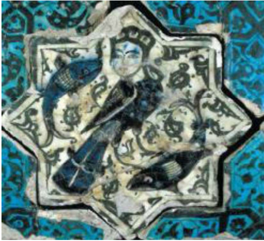
Görsel.6. Siren Motifi

Siren tasvirlerinden bazılarının farklı formda yapıldığı dikkati çeker. Kanatları açık olarak duran ve gövdeleri damla şeklinde olanları da vardır. Sirenlerin yüzleri profilden verilmiş fakat vücutları hafif dönük şekilde resmedilmiştir. Hem yüzleri hem de vücutları profilden verilmiş olanların kanatlarında helezonlar vardır. Etrafında boşluklara yerleştirilmiş olan bitkisel ya da çizgisel süslemeler dengeli sağlar. Mavi ve kahverengi ağırlıklı olarak kullanılmıştır. (Albayrak, Davun, 2021 :202)