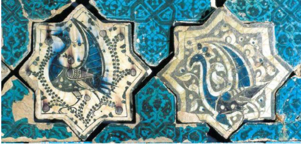
Görsel.5. Tavus kuşu

Anadolu Selçukluları için önemli olan bu iki figürün yanında; at, eşek, aslan, balık gibi hayvanların yer aldığı çiniler de bulunmuştur. Kubadabad Sarayı çini gruplarından bir tanesi de figüratif süslemelerdir. Bunlar farklı formlarda ya da farklı karakterlerde karşımıza çıkar; örneğin mitolojik karakterlerin ön planda olduğu siren motifinin uygulandığı çiniler buradaki kazılarda ele geçirilmiştir. Kadın başlı ve kuş gövdeli olan bu mitolojik karakterin yüz ifadesi, Orta Asya'dan gelen klasik Uygur yüz tipine uygundur. Badem gözlü, yuvarlak yüzlü, ince ağızlı ve küçük burunlu olan bu karakter, bazı çinilerde kanatları kapalı iken bazılarında iki yana açmış şekilde resmedilmiştir.