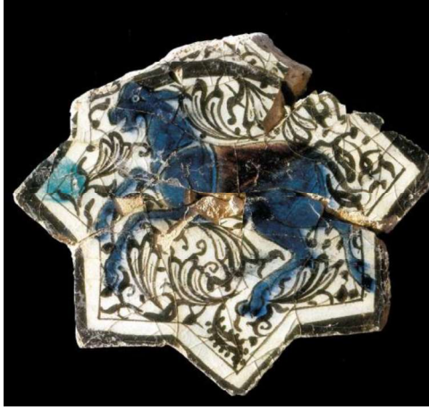
Görsel.16. Kubadabad Sarayı Keçi Figürü

Kubadabad sarayı çinilerinde bulunan hayvan figürleri, yanında belli bir kompozisyon ile ya da mücadele sahnesinin içinde resmedilmiştir. Paşabahçe Kristalin çini grubunda aslan, at, keçi ve eşek ile yapılmış olan çinilerin benzerlerine yer verilmiştir. Aslan, yaşam koşullarına uygun olmayacak şekilde sadece güç ve hükümdarı simgelediği için yapılmıştır. Kubadabad sarayı çinilerinde pek çok sahnede güç ve zafer işaretleri kendini gösterir. Görsel 16.'da Kubadabad sarayı çinilerinde bulunmuş olan bir keçi figürü görülmektedir. Mavi ve kahverenginin hâkim olduğu bu çinide, bitkisel süslemeler de dikkati çeker. Görsel 17.'de aynı çininin benzeri başarılı şekilde uygulanmıştır.