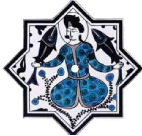
Görsel.11. Paşabahçe Kristalin Çini

Sayılsız yumurtası ile sonsuzluk ve bereketi temsil eden balığı elinde tutan insanın resmedildiği Kubadabad çinisinin, kristalin çinilerde uyarlanmış şeklidir. Görsel. 10'da elinde 2 tane balık tutmuş bir insan vardır. Figürün başında haleye benzeyen bir yuvarlak vardır. Üstüne puanlı bir kaftan giydiği görülür. Yine figürün oturduğu yerde birkaç tane bitkisel süsleme kendisini gösterir. Yüzü Uygur tipine benzeyen klasik Türk yüzüdür. Oturuşu da Türk oturuşu adını verdiğimiz bağdaş kurmuş şekilde resmedilmiştir. Görsel 11.'de Paşabahçe firmasının üretmiş olduğu kristalin çiniler içerisinde yer alan çini grubundan bir parça görülmektedir. Bu parça Görsel.10.'daki çininin benzeri bir çalışmadır. Benzerlik ve incelik konusunda çalışma oldukça başarılıdır.