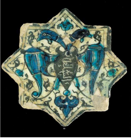
Görsel.2. Kartal Figürü

Orta Asya'da Kartal GÖK'e ulaşma, bu yolculuk sırasında refakat eden en önemli figür olarak karşımıza çıkar. Kartal figürü aynı Kurt figüründe olduğu gibi hükümdarlığı ve gücü temsil etmektedir. Dede Korkut hikayelerinde de kartal figürüne yer verilmiştir. Çift başlı ve tek başlı kartal Hükümdarlığı, Gök'e ulaşmayı ve gücü temsil eder. (Şahin,2021;104)