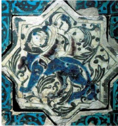
Görsel.14. Sfenks figürlü Kubadabad Çini

Sfenks kendilerini koruduklarına inandıkları mitolojik bir karakterdir. İnsan başlı ve aslan vücutludur. Gövdesinin üst bölümünde keskin bitişli kanatları bulunur. Yüzü bütün Kubadabad çinileri figürlerinde görünen klasik Uygur tipindedir. Görsel. 14'te bulunan görsel Kubadabad Sarayı çini kalıntılarına ait bir sfenks'dir. Hafif cepheden resmedilmiş yüzü dikkati çeker. Mavi rengin hâkim olduğu bir kompozisyon vardır. Bulunduğu alanda, bitkisel süslemeler sıklıkla kullanılmıştır. Görsel.15'te ise, aynı çininin Paşabahçe tarafından yapılmış olan başarılı bir örneği dikkati çeker.