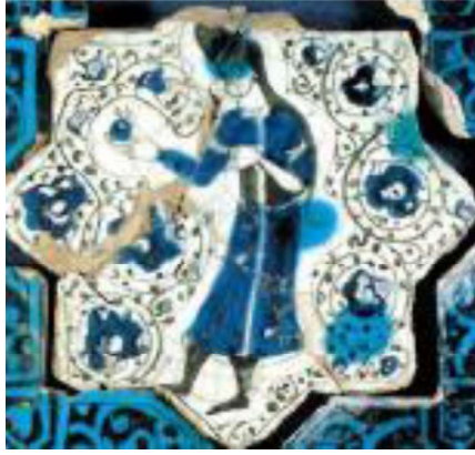
Görsel.12. Elinde Nar Tutan İnsan