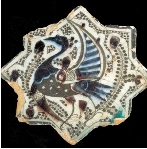
Görsel.20. Kubadabad Çinisi Tavus Kuşu