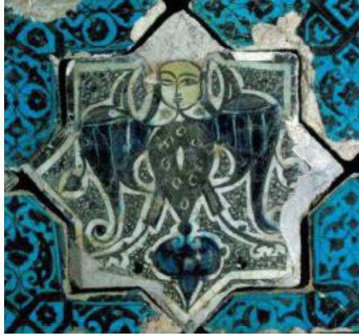
Görsel.7. Siren Motifi

Yine Kubadabad sarayı kalıntılarında karşımıza çıkan bir diğer mitolojik karakter sfenks'dir. Sfenks insan başlı, aslan vücutlu bir yaratıktır. Bu karakterde, aynı siren figüründe olduğu gibi klasik Uygur yüz