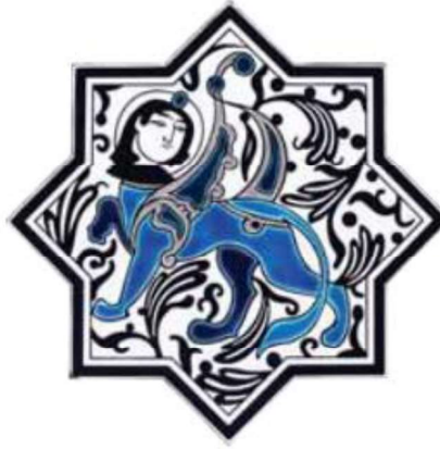
Görsel.15. Paşabahçe Kristalin Çini