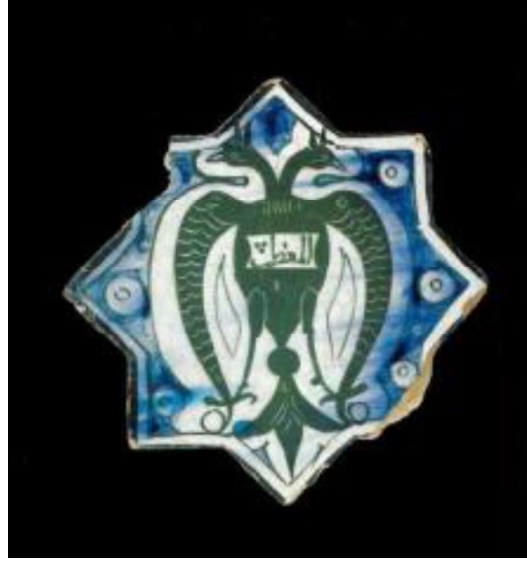
Görsel.3. Kartal Figürü

Kutsal saydıkları kartal figürünü sultan ile bağdaştırmışlardır. Hem sultana hem de kartala aynı anlamı yüklemişlerdir. Bu sebeple kartal figürlerinin bazılarının gövdelerinde Es-Sultan yazmaktadır. Kendileri için önemli olan bir diğer hayvan ise kuştur. Orta Asya'da kuşun, ölümden sonra insanların ruhlarını cennete ulaştırdığına dair olan inanış Anadolu Selçuklu dönemine kadar varlığını sürdürmüştür. Kubadabad sarayında yapılan kazılarda ele geçirilen çini eserlerde yırtıcı olan ve olmayan çeşitli tiplerde kuş motiflerine de rastlanmıştır.