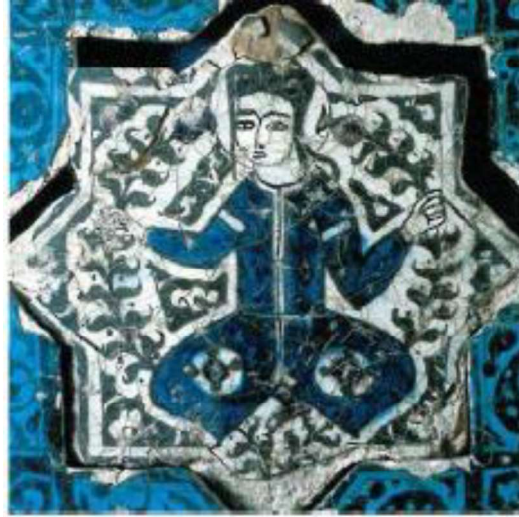
Görsel.9. bağdaş kurmuş figür

Kubadabad Sarayı kazılarında insan figürlerinin yer aldığı parçalar da bulunmuştur. Bunlar oturmuş, bağdaş kurmuş şekilde, ellerinde kadeh tutan insan figürleri, elinde balık olan insan figürü şeklinde ya da iki yanında bitkisel motif bulunan insan figürü şeklinde yer almaktadır. Uygur yüz tipinin hâkim olduğu insan figürlerinde badem gözlü, küçük burunlu, küçük ağızlı ve yuvarlak yüzlü yüz tipi özellikleri görülür. Genellikle sultan ve saray çevresinden kişiler resmedilmiştir.