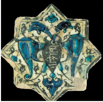
Görsel.18.Çift Başlı Kartal