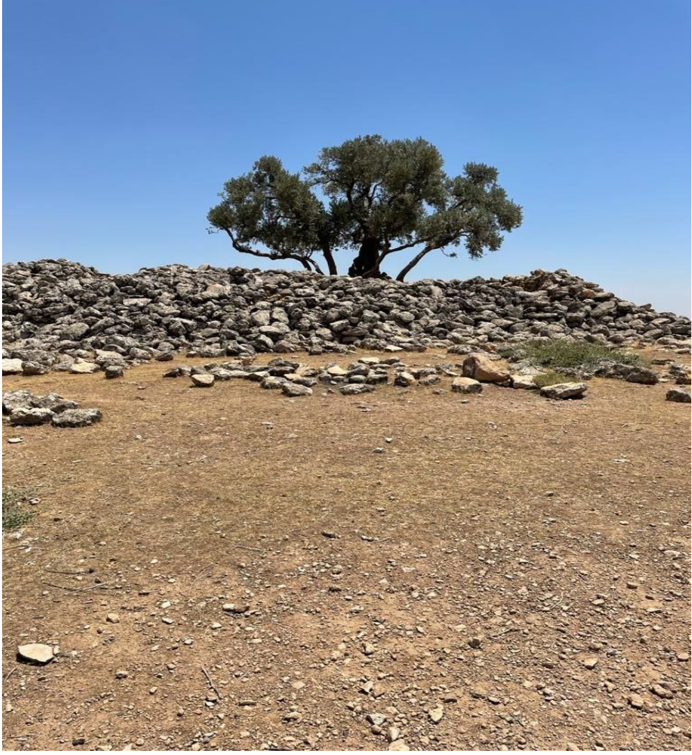
Şekil 4: Altınbaşak Köyü yakınında bulunan ve Göbekli Tepe ile benzer dini amaçlarla ziyaret edilen başka bir “Göbekli” tepe ve en tepesindeki yaşlı zeytin ağacı