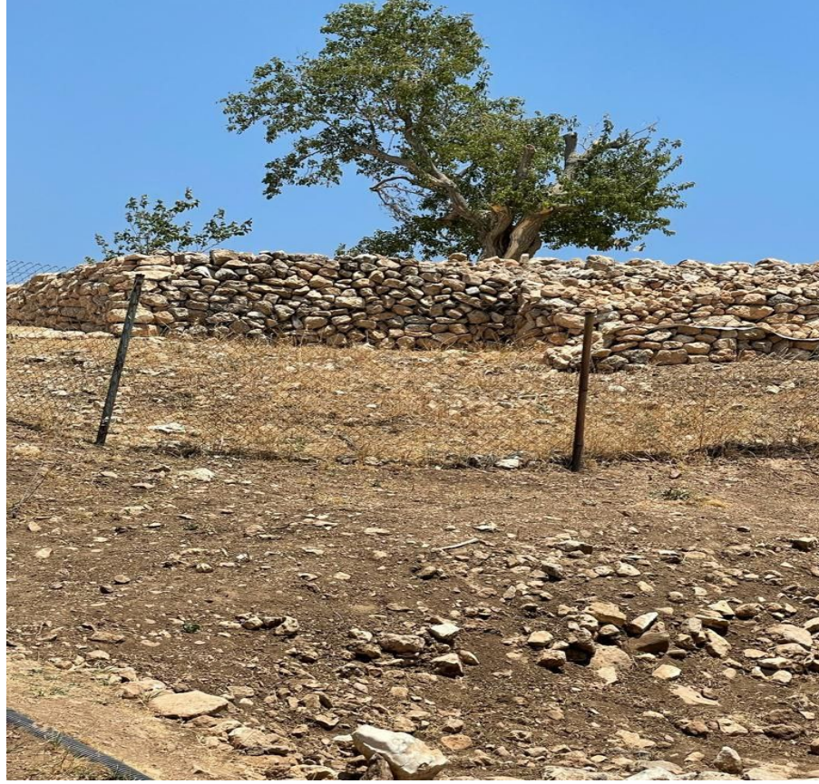
Şekil 3: Göbekli Tepe'nin en tepesinde kazı öncesinden kalma dut ağacı

Saha çalışmasında Şanlıurfa ilinin güneyinde Eyyübiye İlçesi Altınbaşak Köyü'nde hem benzer motivasyonlarla ziyaret edilen ve ismi de Göbekli olan başka bir Tepe bulunmaktadır. Köye yakın bölgeye hakim bu tepenin üstünde yaşlı bir zeytin ağacı bulunmaktadır (Şekil 4). Yöre halkı tepeye “Göbekli” veya “Göbekli Ziyareti” demektedir 2 . Köyün muhtarı yaşlı zeytin ağacına “Göbekli Zeytin Ağacı” dediğini ifade etti. Dışardaki insanların da burayı “ziyaret” olarak bildiğini vurguladı. Çocukları olmayanlar, hasta olanlar veya hırsızlık yapanları yemin ettirmek isteyenlerin sürekli geldiklerini belirtti. Görüşmede buranın da kutsallığını zamanın birinde “mübarek” bir kişinin şehit olabileceğini, veli bir zatın uğramasından veya bir süre yaşamasından almış olabileceği belirtti. Buraya da insanların çocuk sahibi olma, şifa, bereket, yemine tutma, kısmetin açılması gibi nedenlerle geldiği ve adaklar adandığı köy muhtarının ifadelerinden anlaşılmaktadır. Ayrıca insanların herhangi bir dileğini de zeytin ağacına bez bağlayarak dilediklerini ağacın dallarına bağlanmış bez parçalarından anlamak mümkündür (Kişisel Görüşme, Altınbaşak Köyü muhtarı, 20.06.2021).