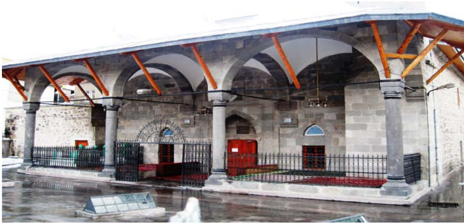
Resim-II; Câferiye Camii'nin Kuzeyden Görünüşü.