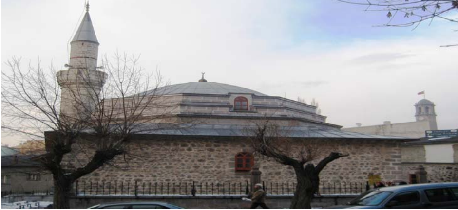
Resim-I; Câferiye Camii'nin Güneyden Görünüşü.