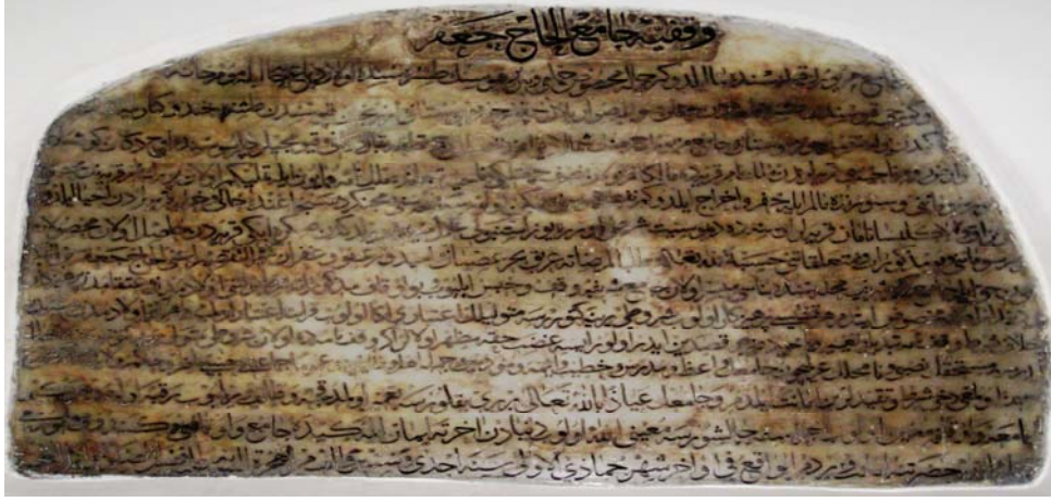
Resim-III; Mahfilde Bulunan Mermer Vakfiye. Asıl Vakfiye Metnine Göre Eksiktir.