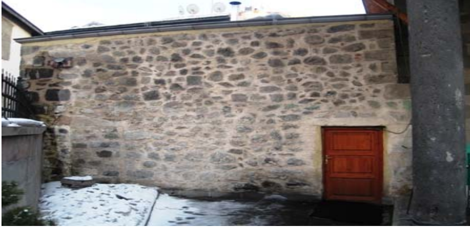
Resim-V; İtikafhâne. Eski Giriş Kapısının Sol Tarafında Olduğu Görülmektedir.