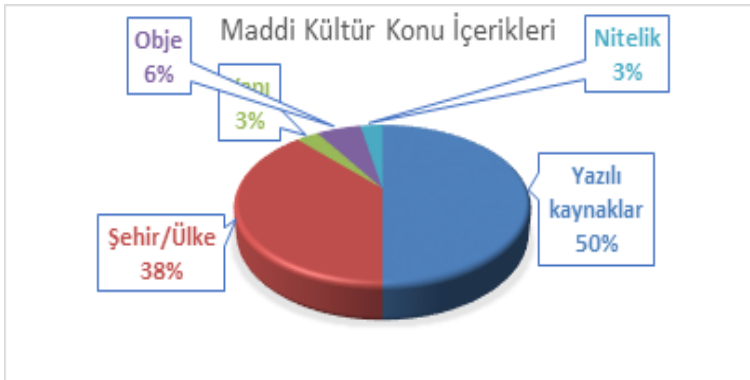
Grafik 2. İncelenen lisansüstü tezlerde maddi kültür kapsamında ele alınan konu içeriklerinin yüzdeleri dağılımı.