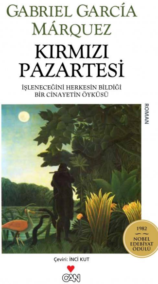
Resim 4 Can Yayınları, Basım Yılı:2013,112 sayfa.

Genel hatlarıyla klasik beyaz kapak tasarımının şablonuna sadık kaldığı görülen Resim 4'teki kapak tasarımının düzenlamı incelendiğinde, öncelikle yayınevi ad ve logosunun kapaktaki resmin üstünden altına kaydırıldığı fark edilmektedir. Kitabın bilinen 'Kırmızı Pazartesi' adının hemen altına aynı renkte fakat daha küçük puntolarla, "İşleneceğini Herkesin Bildiği Bir Cinayetin Öyküsü" yazısının eklendiği görülmektedir. Bu, Kırmızı Pazartesi kitap kapağı tasarımlarında ilk ve son kez uygulanmıştır. Ayrıca altın renkli bir daire içine yerleştirilmiş olan "1982 Nobel Edebiyat Ödülü" yazısının ve kitabın türüne dair bilginin, resmin sağ tarafına farklı yönlerde yerleştirildiği; resmin klasik tasarımda içine alındığı siyah çerçevenin bu tasarımda kaldırıldığı da gözlemlenmektedir.