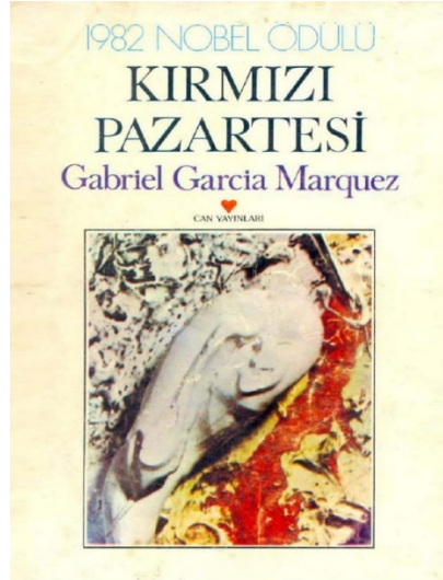
Resim 1 Can Yayınları, Kapak Tasarımı: Erkal Yavi, 1.Basım:1982 ,114 sayfa.

Gösterge şeması Tablo 1’de verilen kapağın tasarımındaki ölü kuş yananlam bağlamında incelendiğinde, Santiago Nasar’ın ölümünü temsil etmektedir. Beyazlar giyinerek güne başlayan Nasar, birkaç saat sonra öleceğinden habersiz, rüyasını annesine anlatmış ve okuyucuya rüyasının gerçekleşeceği mesajını iletmıştır. “Düşünde kendini incecikten bir yağmurun yağdığı dev incir ağaçlarının oluşturduğu bir ormandan geçerken görmüş, bir an için mutlu olmuş, uyandığında üstünün başının kuş pisliğinden görünmez olduğu duygusuna kapılmıştı” (Márquez, 1996, s.9). Beyaz renk saflığı, temizliği, doğallığı, doğruluğu temsil ederken kırmızı rengin tehlike, tutku ve cinselliği temsil ettiği düşünüldüğünde; Nasar’ın beyaz bir kuş olarak temsil edilmesi, rüyasındaki kuş pisliğinin üstüne atılacak bir iftiranın habercisi olması, akan kanın hem Nasar’ın bozduğu düşünülen bekarate atıfta bulunması hem de bu sebeple bir namus cinayetinin baş kahramanı olarak ölümünü işaret etmesi tasarımın yananlamını besleyen unsurlardır.