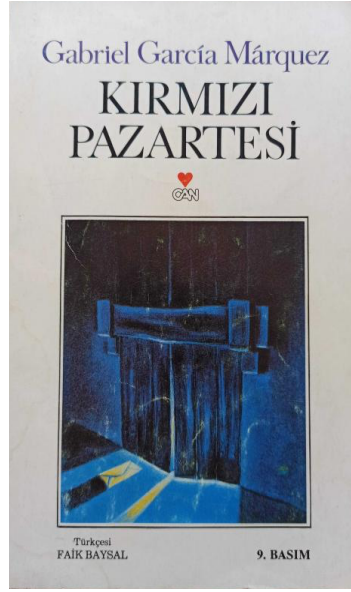
Resim 3 Can Yayınları, Dizgi: Serap Kılıç, 1996, 111 sayfa.