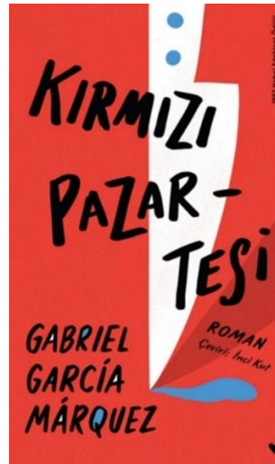
Resim 6 Can Sanat Yayınları, Kapak Tasarımı: Utku Lomlu/ Lom Creative, 1.Basım:2019, 117 sayfa

Resim 6'da Utku Lomlu tarafından tasarlanan ve Can Sanat Yayınları'nın 2019 yılında yayımladığı Kırmızı Pazartesi kitap kapağı bulunmaktadır. Kırmızı rengin baskın olarak kullanıldığı kapakta tasarımcının illüstrasyon yoluyla mesaj iletmeye çalıştığı görülmektedir. İllüstrasyonun baş kahramanı, kan kırmızısı bir zemin üzerine yerleştirilmiş bir bıçaktır. Modern, minimalist ve düz tasarım yaklaşımı ile yapılmış olan bu tasarım, Can Sanat Yayınları'nın Kırmızı Pazartesi kitap tasarımlarının 1981 yılından bugüne kadarki en sade kapağının temsilcisidir. Ciltli basılan bu kapağın tasarımında kullanılan kontrast renkler, nesnelere daha belirgin, yazıları daha okunur kılmaktadır.