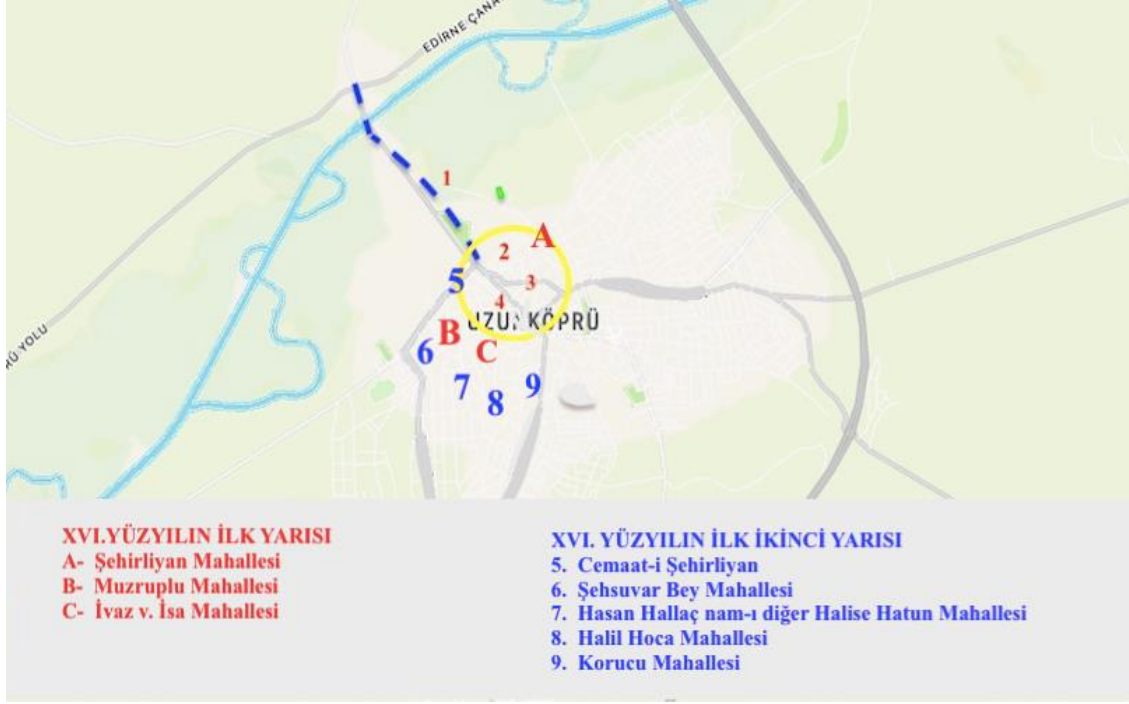
Harita 2 - XVI. Yüzyılda Ergene Şehri

sınırları içinde 10 çift hanesi kayıtlıdır 92 . Câminin güneyi fonksiyonel yapıların bulunduğu kısım olduğu için burada tarım yapmaya uygun bir alanın bulunması söz konusu değildir. Şu halde yeni kurulan Câmî-i Şerif Mahallesi Sultan II. Murad Câmîi’nin kuzey cihetinde yer almalıdır. Buradaki boş araziler tarıma açılmak suretiyle yeni bir iskân mahalli oluşmuştur. Mahallenin nüfusu 40 hane 10 mücerred olmak üzere yaklaşık 210 kişi civarındaydı. Câmî-i Şerif Mahallesi içinde yer alan cemaat-i Şehirliyan ise 57 hane 7 mücerredten müteşekkildir 93 .