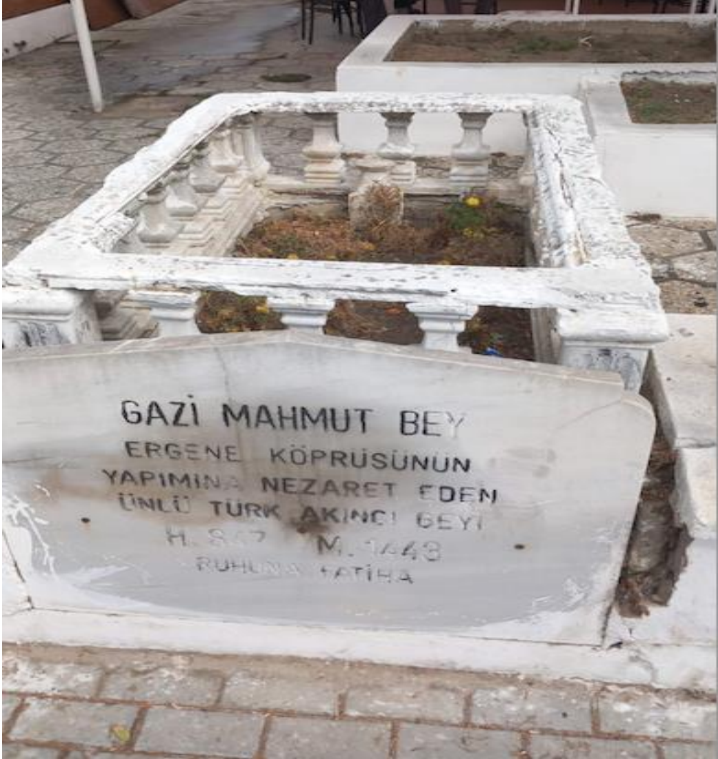
Fotoğraf 1- Ergene köprüsü başında şehrin girişinde bulunan Mahmud Baba'nın mezarı 125 .

(Halk arasında ve modern kaynaklarda hatalı olarak Mahmud Baba'nın II. Murad devri komutanlarından olup köprünün yapımına nezaret eden bir akıncı beyi olduğu söylenegelmiştir. Bu söyleniş zaman içerisinde kanıksanmış olacak ki, Mahmud Baba Türbesi'ne ilâve edilen mezar taşına da aynı şekilde nakşedilmiştir. Mahmud Baba muhtemelen I. Murad ya da Yıldırım Bayezid devrinde yaşamış bir Bektaşî dervişidir. Ayrıca mezar taşında yer alan H. 847 (1443) tarihi ise yine hatalı Mahmud Baba'nın ölüm tarihi gibi gösterilmiştir. Fakat bu tarih Sultan II. Murad'ın inşa ettirdiği Ergene Köprüsü'nün bitiş tarihidir.)