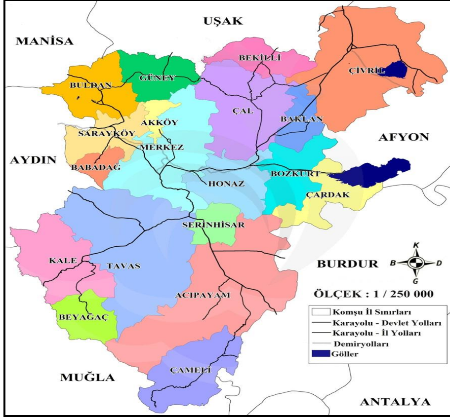
Harita 1. Bekilli İlçesi'nin Lokasyon Haritası