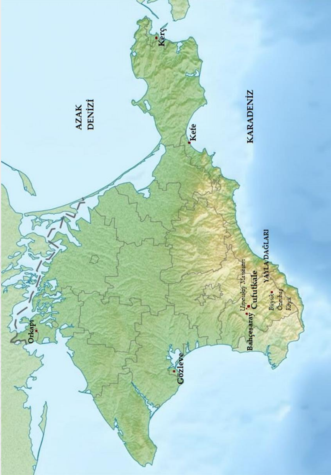
Ek 1. Çalışmada Adı Geçen Yerlerin Haritası