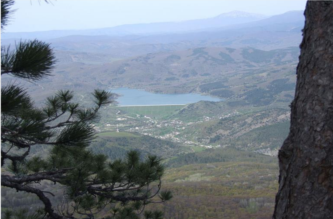
Ek 5. Büyük Özenbaş Köyü, Günümüz 37