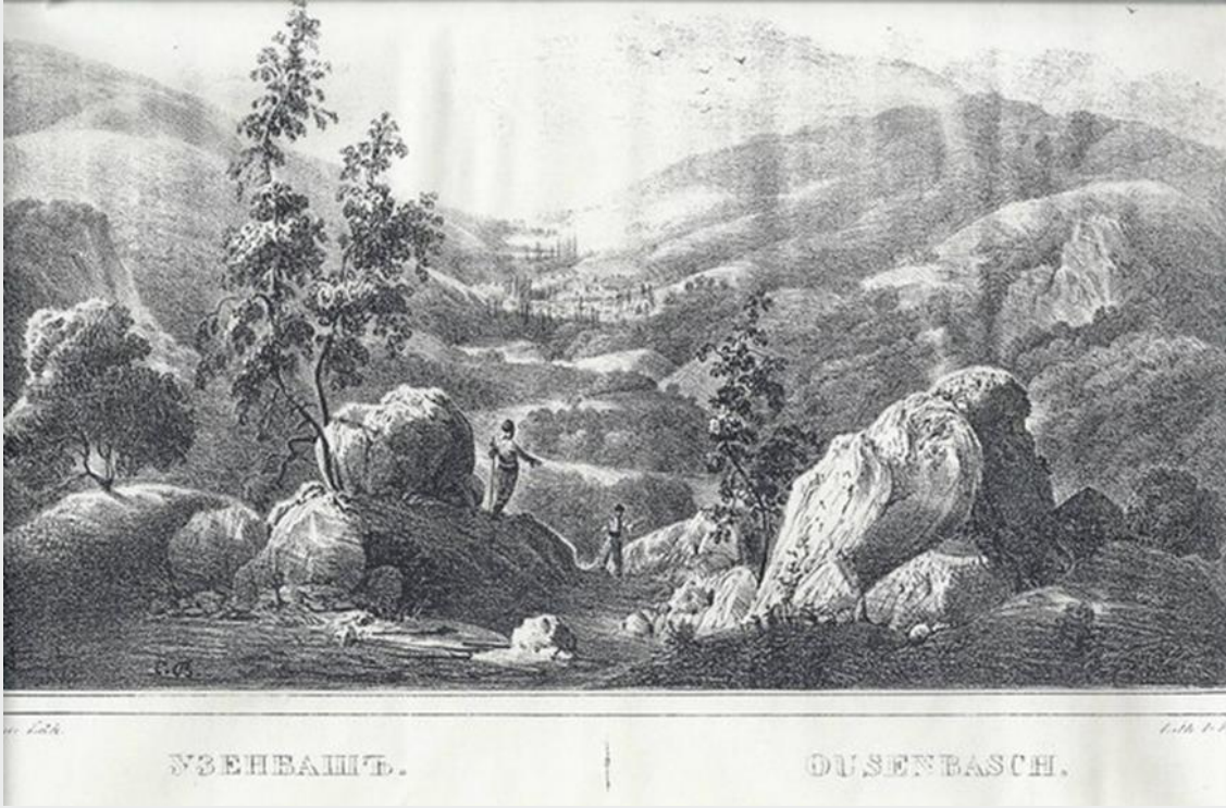
Ek 4. Büyük Özenbaş Köyü, 1842 36