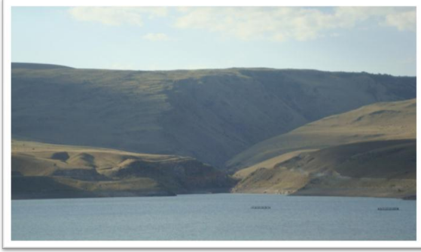
Şekil 6.Arçovid Vadisi