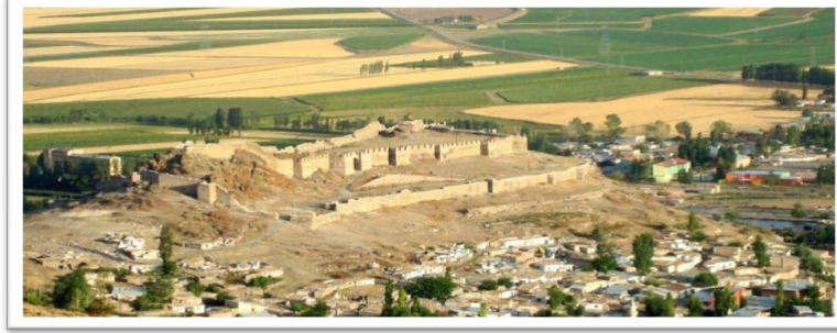
Şekil 2. Kaputru Kalesi'nin Batıdan Görünüşü