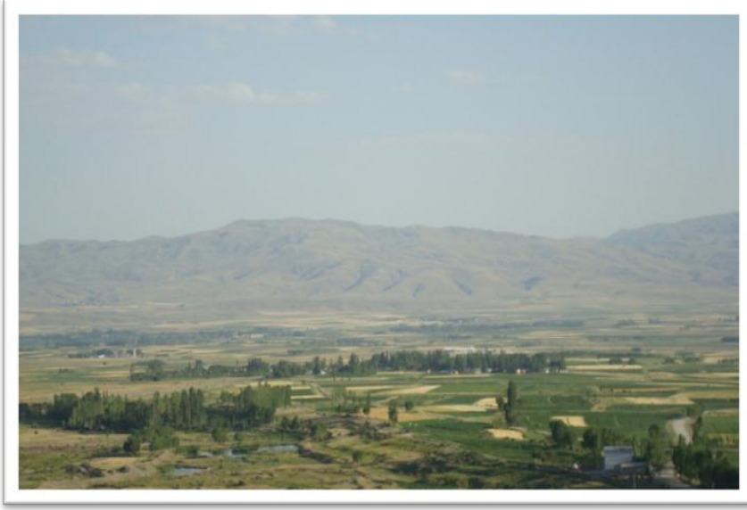
Şekil 5. Kaputru Savaşı'nın Yapıldığı Okomion (Okomi-Ügümü )Kasabası