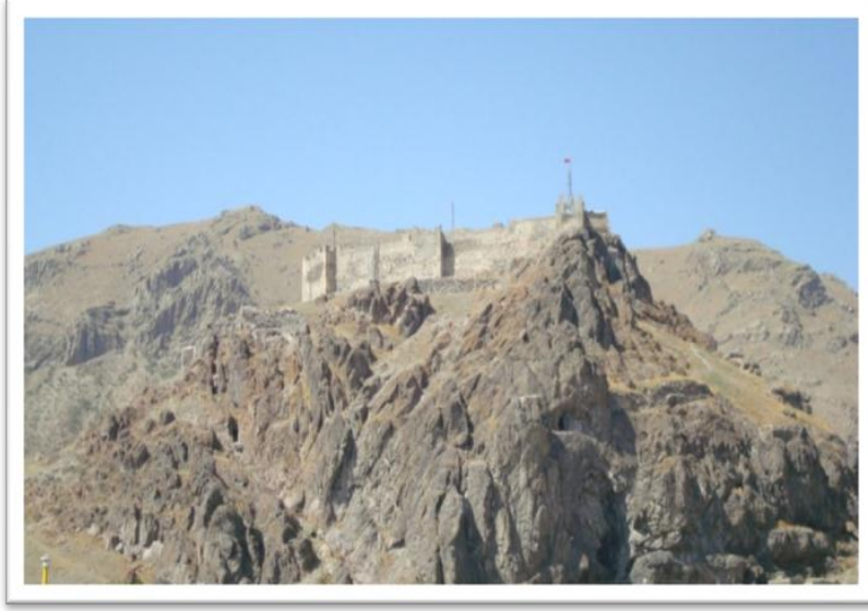
Şekil 3. Kaputru Kalesi