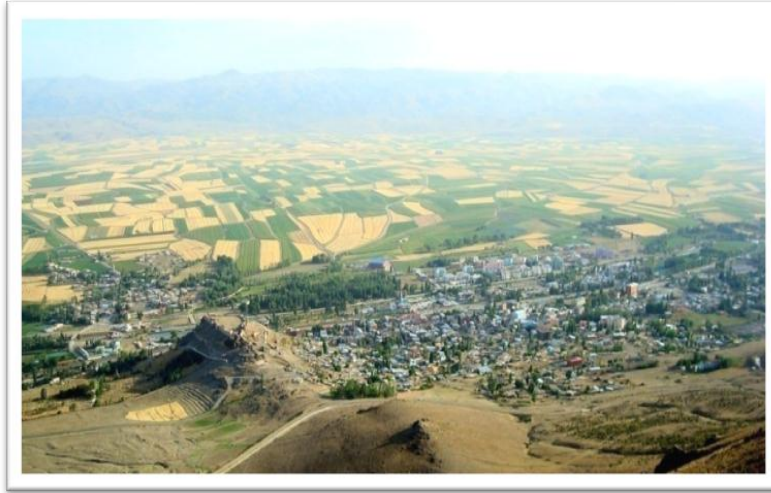
Şekil 1. Pasinler'in Hasanbaba Dağı'ndan Görünüşü