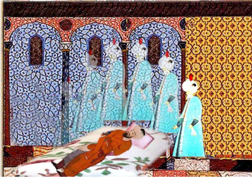
Resim 9. Muhammed Humayun'un Hastalığında Yapılan Nezir Töreni.