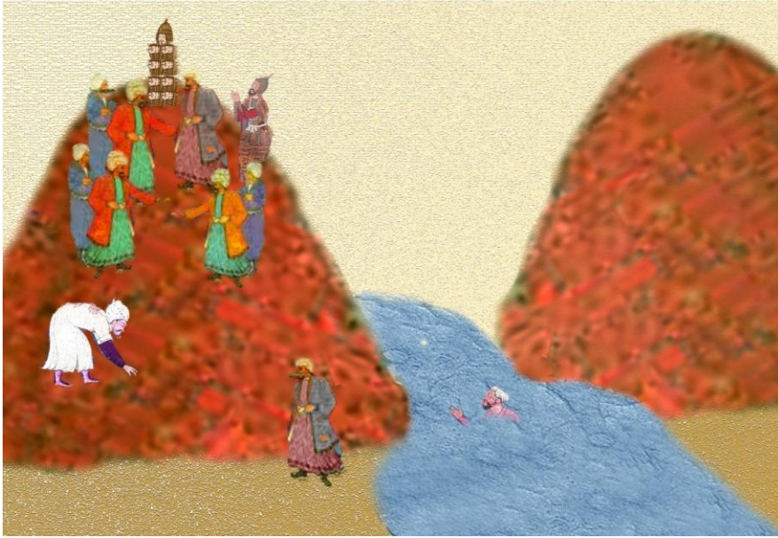
Resim 3. Afganların Teslim Olma Usülleri.