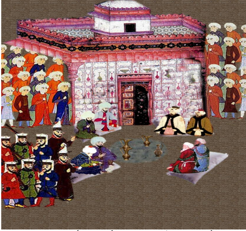
Resim 4. Bâbü ve Bediüzzamân Mirza'nın Görüşmeleri.