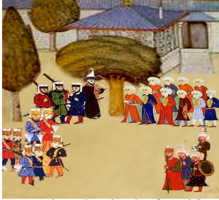
Resim 10. Bâbürnâme'de Yer Alan Teslim ve İtaat Sembolleri.