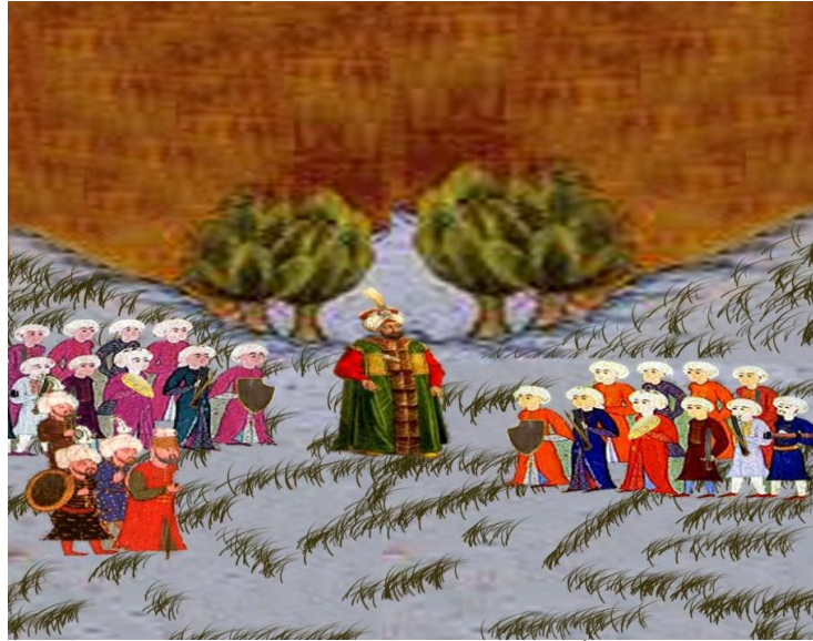
Resim 11. Bâbürnâme'de Yer Alan Teslim ve İtaat Sembolleri.