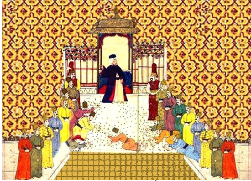
Resim 7. Agra'da Hazinenin Üleştirilmesi.