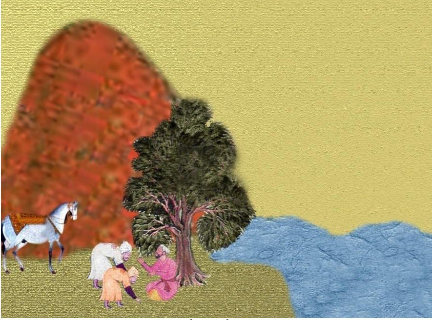
Resim 2. Hüsrev Şâh'ın Bâbü'ün Hizmetine Girmesi.