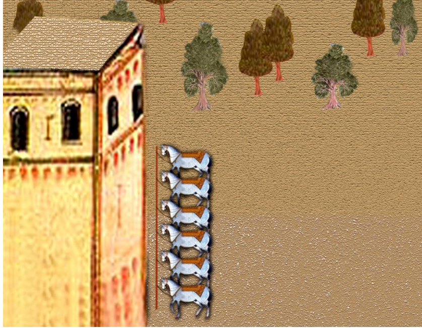
Resim 8. Agra ve Kâbil Arasında Kurulan Posta Teşkilatı.