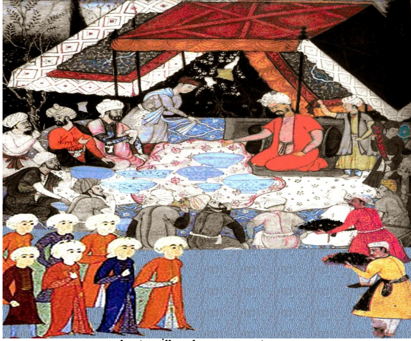
Resim 6. Bâbü'r'ün İlk ođlu Humayun'un Doğum Günü.