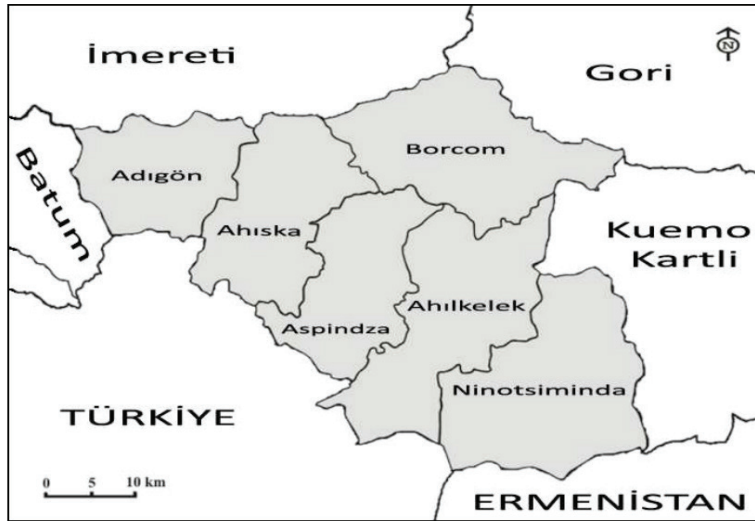
Harita 1. Ahıska Türklerinin Gürcistan sınırları içinde kalan ana yurdunun haritası

Ahıska, Gürcistan toprakları içerisinde Kafkasya Bölgesi'nin güneybatısında yer almaktadır. Ahıska'nın kuzeyinde ve doğusunda Gürcistan, güneyinde Ermenistan, güneybatısında Türkiye, batısında Acaristan Özerk Cumhuriyeti (Gürcistan) bulunmaktadır. Ahıska Türklerinin ana vatanı olan bu bölge Ahıska, Adigön, Aspinza, Ahılkelek, Ninotsiminda ve Borcom gibi önemli yerleşim birimlerini kapsamaktadır (Harita 1). Ahıska Bölgesi'nin toplam yüzölçümü ise 6.260 km 2 'dir. Gürcistan sınırları içinde yer almasına rağmen Ahıska ve Ahılkelek'te Gürcistan hâkimiyetinden söz edilemez. Bu bölgedeki Ermeni oluşumu özerkliğe doğru gitmektedir. Bu durum sadece Ahıska Türkleri için değil, Türkiye'nin güvenliği açısından da büyük önem arz etmektedir. 1