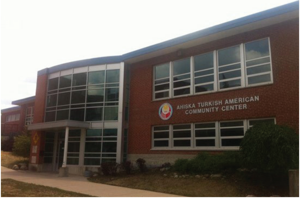
Fotoğraf 4. Ohio Eyaletinin Dayton şehrinde 2012'de açılan Ahıska Türk Kültür Merkezi