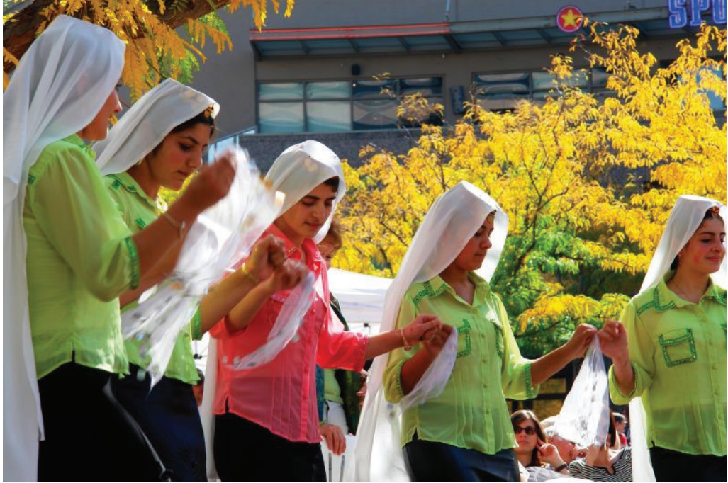
Fotoğraf 3. ABD'de yaşayan Ahıska Türkü kızları yerel kıyafetler ile