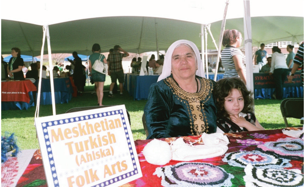
Fotoğraf 5. ABD'de yerel kıyafetler giymiş bir Ahıska Türkü kadını