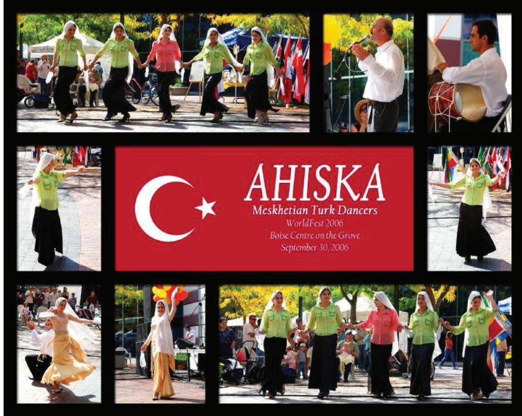
Fotoğraf 2. Ahıska Türklerinin ABD'de düzenledikleri bir etkinlikten kareler

grup dayanışması ve geniş aile bağları sayesinde aşmayı başardılar. Bunun dışında buldukları kentlerdeki Türk Kültür Merkezleri'yle yakın ilişkiler kurmakta ve bir takım etkinlikleri birlikte gerçekleştirmektedirler. Bu etkinlikler arasında konferanslar, eğitim çalışmaları, eğlenceler ve diğer sosyal faaliyetler bulunmaktadır (Fotoğraf 2-5). 35