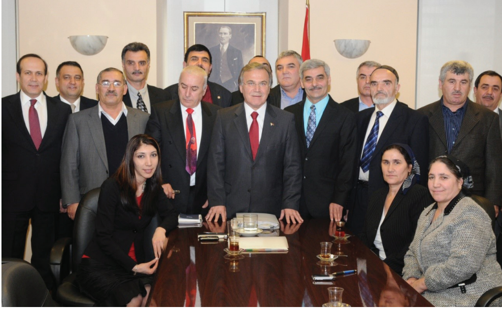
Fotoğraf 1. 24. Dönem TBMM Başkanı Mehmet Ali Şahin ABD'de Ahıska Türkleri ile beraber