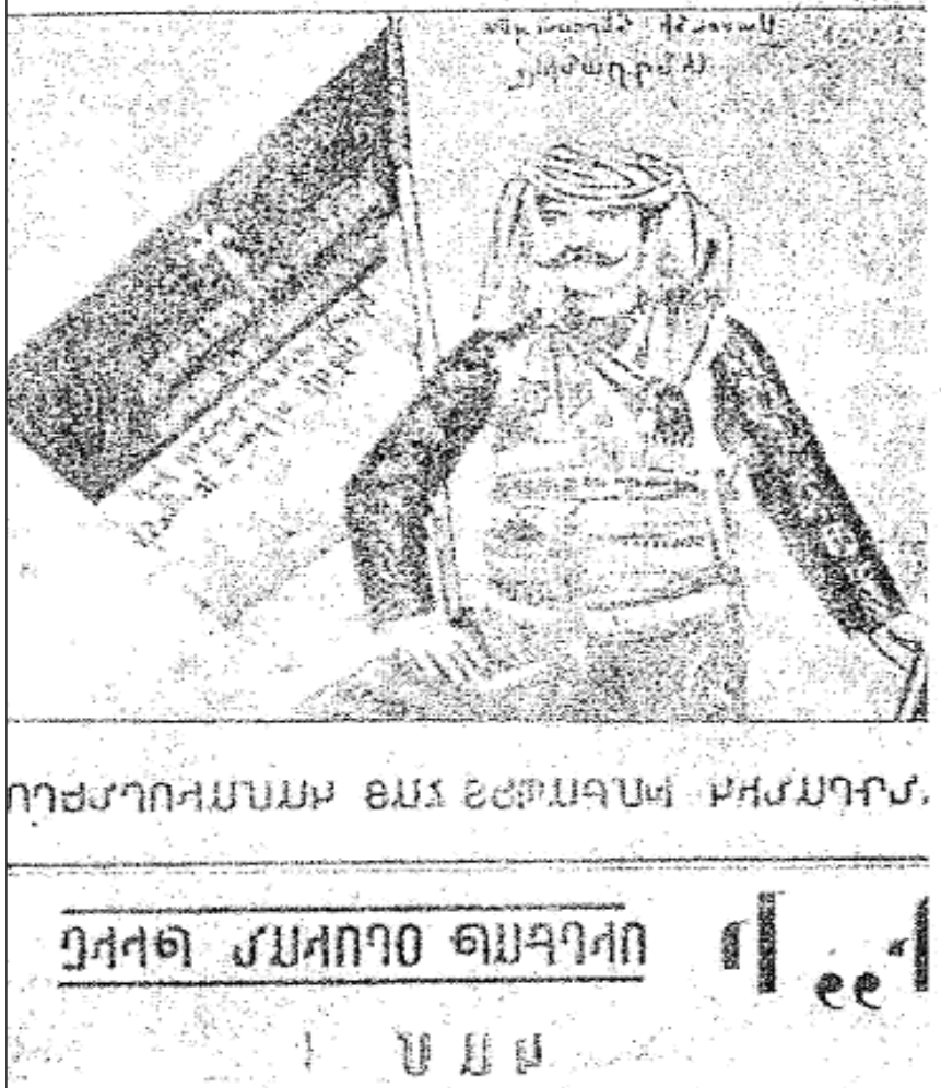
Resim-1: Müslümanları Katleden Ermeni Örgüt Reisi General Andranik Ozanyan