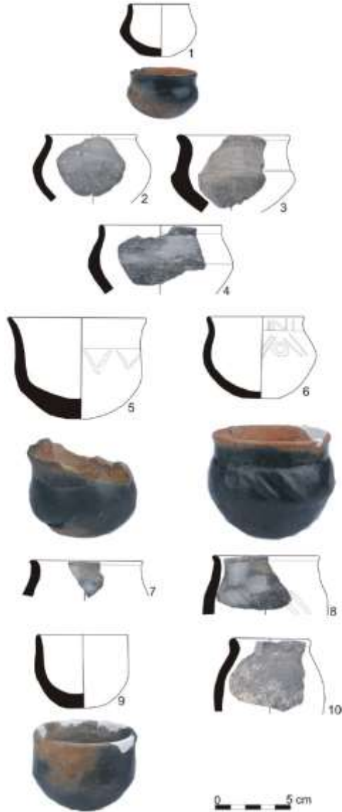
Resim 3: Tepeköy Höyük Karaz Kültürü Çanak-Çömlekleri (Gökçe-Kılıç, a.g.m., fig. 5)