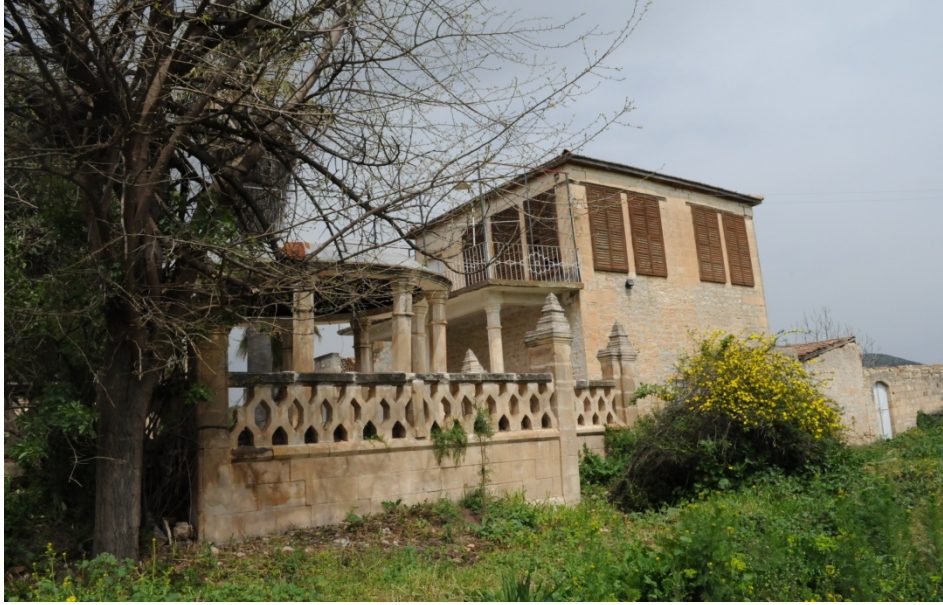
Kilis'te mütarekenin yapıldığı köşke ait resimler.