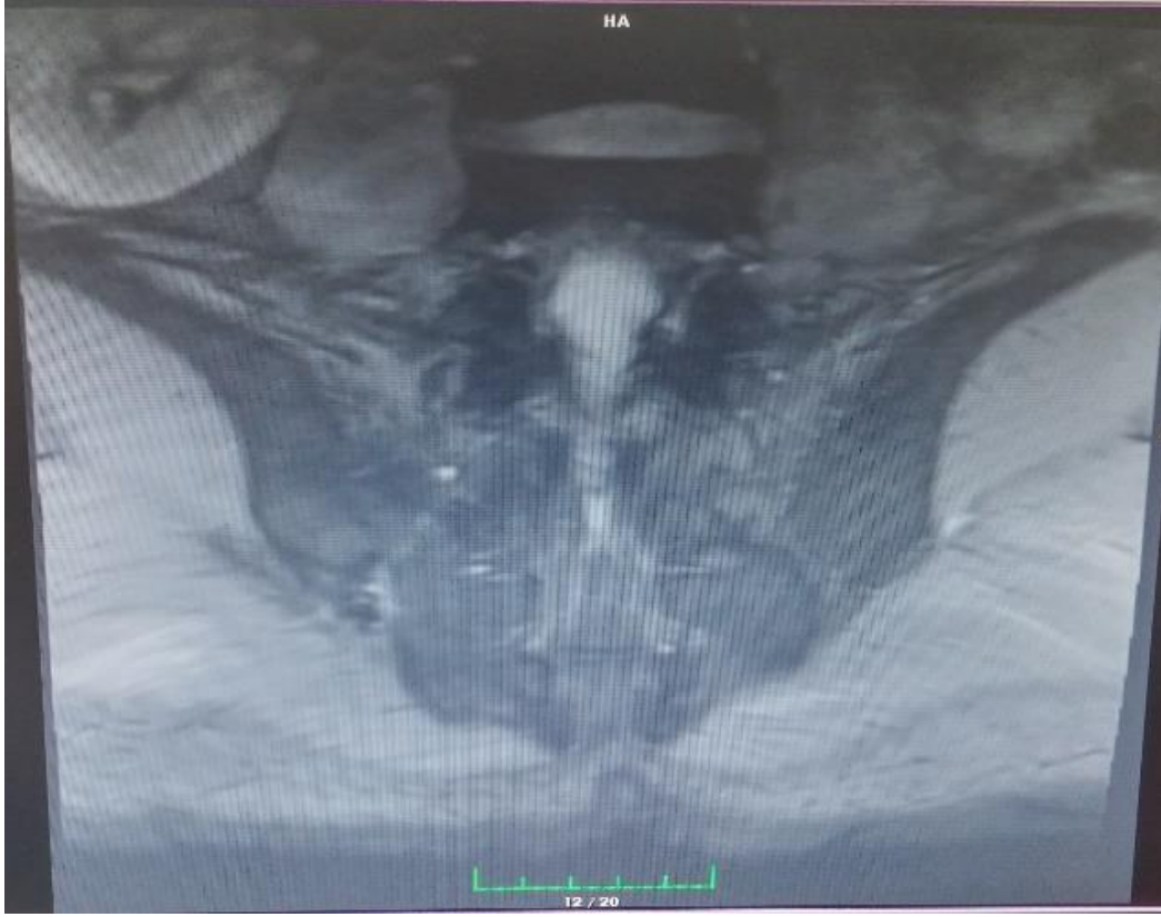
Resim 2. Horizontal düzlemde sağ sakroiliak ekleme ödem

Enfeksiyon hastalıkları bölümünün önerisiyle hasta hastaneye yatırılarak streptomisin ampul 1g/gün intramüsküler, tetrasiklin tablet 200 mg/gün oral kombinasyon tedavisi başlandı. On gün sonra aynı tedavisine evde devam etmek üzere taburcu edildi. Dört hafta sonra klinik şikayetlerinde azalma saptanan hastanın kontrol laboratuvar değerlerine bakıldığında ESH 18 mm/saat, CRP 10 mg/L'a gerilemişti. Streptomisin tedavisi kesilerek doksisisiklin-rifampisin kombinasyonu ile tedaviye üç ay daha devam edilmesi planlanarak kontrole çağırıldı. Bu olgu hastanın onamı alınıp mahremiyeti korunarak hazırlanmıştır.