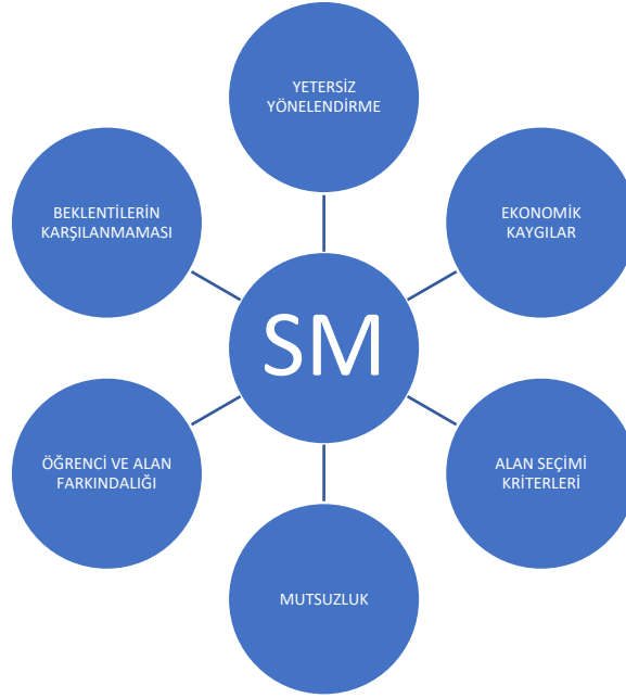
Şekil 2. Beceri Uyumsuzluğu verilerinden elde edilen kodlamalar

Beceri uyumsuzluğu ile ilgili kodlar Şekil 2’de gösterilmektedir.