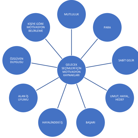
Şekil 4. Gelecek Seçimleri için motivasyon kaynakları verilerinden elde edilen kodlamalar

Odak grup görüşmesinin son aşamasında katılımcılara yöneltilen “gelecek seçimlerini yaparken temel motivasyonlarınız nelerdir? Sorusuna verilen yanıtlar göstermiştir ki temelde ekonomik ve mutluluk gibi güdüler katılımcıların sıklıkla vurgulamış olduğu argümanlar olmuştur.