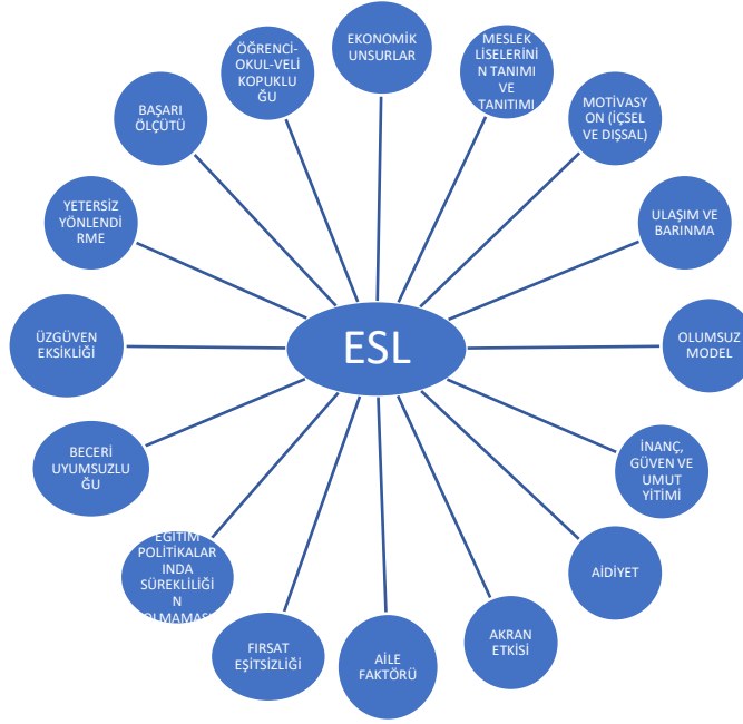
Şekil 1. Okuldan Erken ayrılma (ESL) verilerinden elde edilen kodlar

Okuldan erken ayrılma ile ilgili kodlar Şekil 1’de gösterilmektedir.