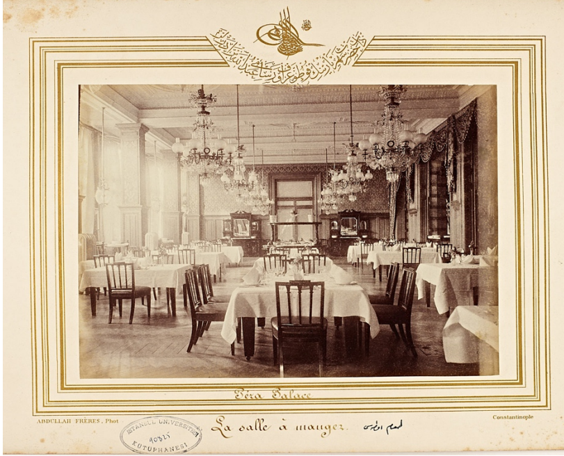
Ek-2. II. Abdülhamid Han Fotoğraf Albümleri, Pera Palas Otel'i'nin Yemek salonu.