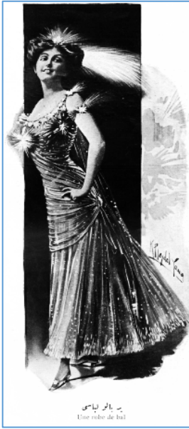
Ek-1. Şehbal, “Bir Balo Libası”, Sayı 24, 14 Ağustos 1910, s. 379.