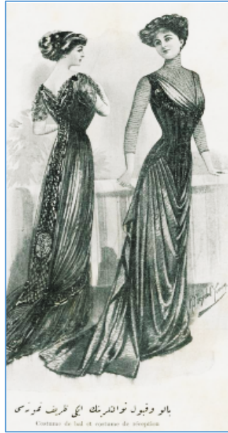
Şehbal, “Balo ve Kabul Tuvaletlerinin İki Zarif Numunesi”, Sayı 31, 14 Aralık 1910, s. 138.