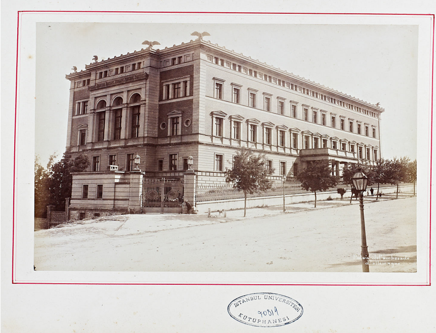
Ek-7. II. Abdülhamid Han Fotoğraf Albümleri, Gümüşsuyu Alman Sefarethanesi'nin dış görünüşü.