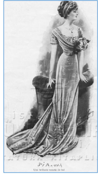
Şehbal, “Parlak Bir Balo Tuvaleti”, Sayı 27, 28 Eylül 1910, s. 59.