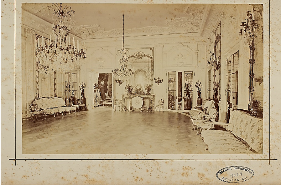
Ek-3. II. Abdülhamid Han Fotoğraf Albümleri, İtalya Sefarethanesinin iç görünüşü.