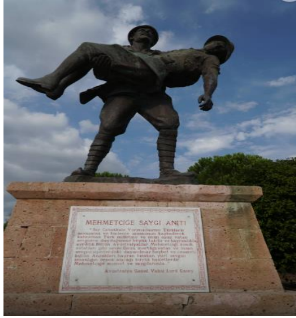
Şekil 8: Mehmetçiğe saygı anıtı