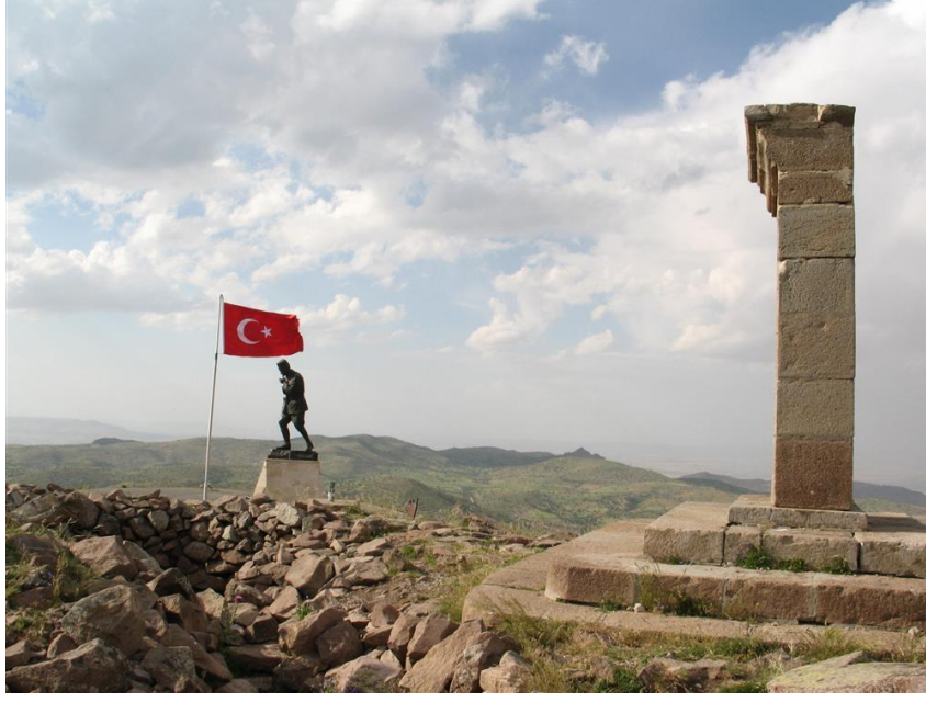
Şekil 1: Kocatepe anıtı ve kitabesi