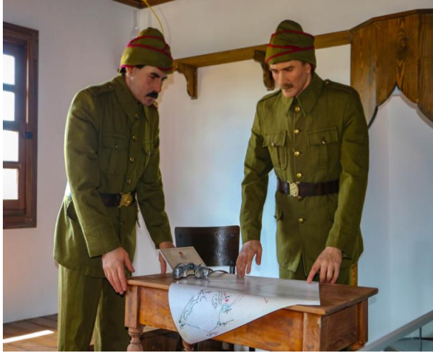
Şekil 5: Bigalı Atatürk evi ve müzesi