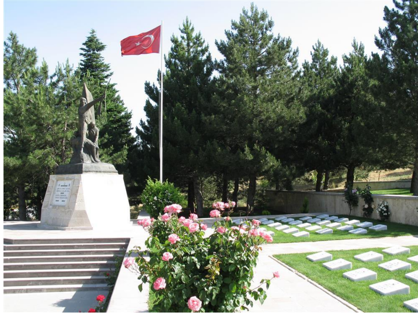
Şekil 2: Anıt kaya şehitliği

Kaynak: Kültür ve Turizm Bakanlığı (2023) Anıt kaya şehitliği