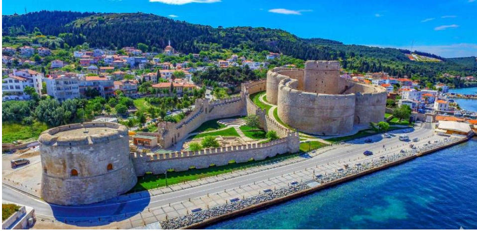
Şekil 7: Kilitbahir kalesi