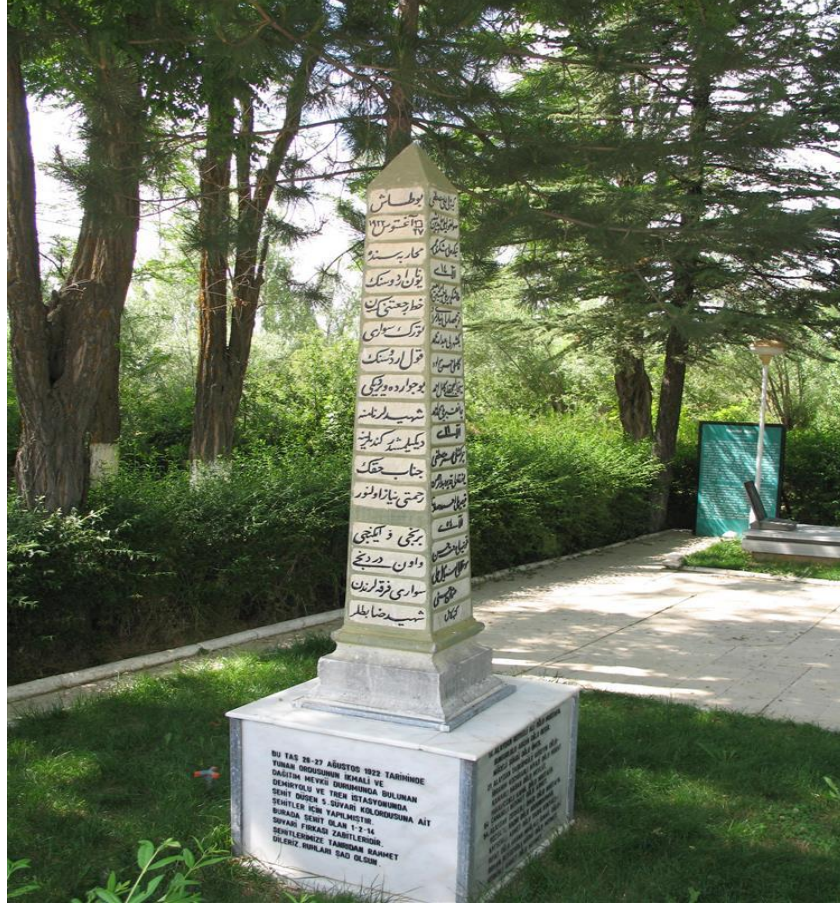
Albay Reşat Çiğiltepe şehitliği

Giresun şehitliği, Giresun ve yöresinden gelen gönüllü askerlerin şehit olmasından dolayı bu ismi almıştır. Dumlupınar Savaş müzesi, 1977 yılında ziyarete açılmıştır. Atatürk evi ise aslına uygun olarak 2003 yılında ziyarete açılmıştır. Büyükaslanhanlılar şehitliği Milli mücadelede süngüsünü takmış, düşman üzerine saldırmaya hazır binlerce askerimizi sembolize etmektedir. Bununla birlikte gelecek nesillere vatan toprağının nasıl kazanıldığının bilincini ve ruhunu aktarmak için Başkomutan Tarihi Milli Parkı İstiklal Tanıtım Merkezi yapılmıştır. Tanıtım merkezi, ziyaretçilere Büyük Taarruz ve Kurtuluş Savaşı'nı anlatan, savaşın şiddetini bir bütün şeklinde görebilme imkanı sunan panoramik müze niteliğinde tasarlanmıştır.