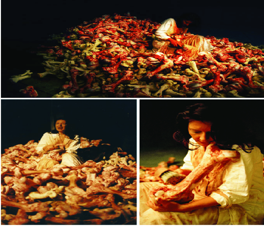
Görsel 6. Marina Abramović, Balkan Baroque , 1997, Performans, 47. Uluslararası Venedik Bienali'nin İtalya Pavyonu.