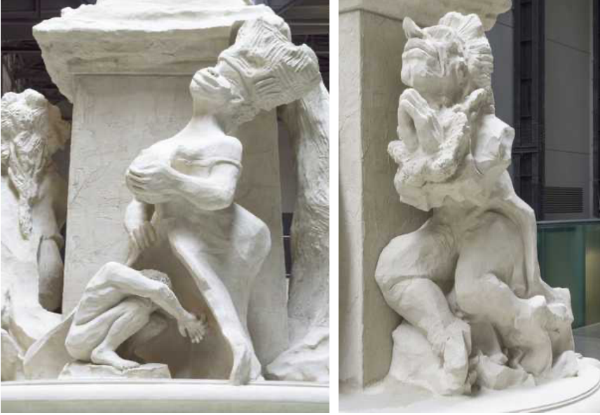
Görsel 4. Kraliçe Vicky Fons Americanus, detay