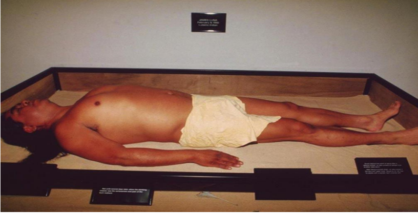
Görsel 2. Kültürel Nesne, yandan görünüm.