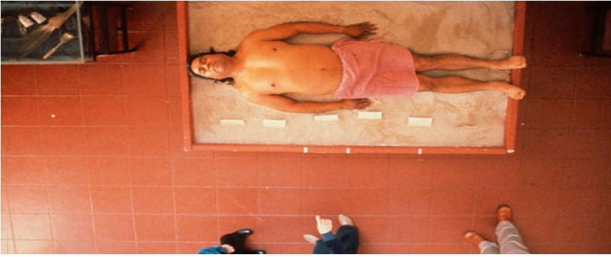
Görsel 1. James Luna, Kültürel Nesne , 1987, Performans, Bilbao Parkı Medeniyet Tarihi Müzesi, San Diego, A.B.D.

Postmodernizm'in bir getirisi olan çoğulcu yapı, izleyiciyi düşündüren, şoke eden ve izleyiciye farklı deneyimler sunan bir sanat fikrinin gelişmesine katkı sağlamıştır. Bu sayede çok kültürcü bir sanat eğiliminin önemi vurgulanmış olur. Amerikan müzelerinde etnik köken, ırk ve cinsel kimlik açısından farklı (öteki) olanların ifade edilme imkânı bulunduğu sergiler düzenlenmeye başlandı. Bunlar sanattaki çok kültürlü eğilimin önemli göstergeleriydi. James Luna'nın Kültürel Nesne adlı performansının da bu gelişmeler doğrultusunda ortaya çıktığını söylemek mümkündür.