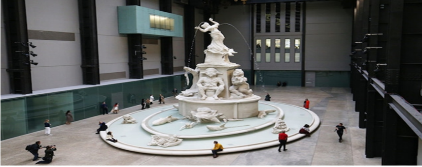
Görsel 3. Kara Elizabeth Walker, Fons Americanus , 2019, Heykel, Tate Modern, Londra, Birleşik Krallık.

kaderlerine ve trajedilerine atıfta bulunarak suyu ana tema olarak kullanmıştır. Gerçek, fantezi ve kurmacayı bir araya getiren Fons Americanus, bu anlatının temsili olarak karşımıza çıkmaktadır. Walker, çalışmasını "bir kültürel özneden bir İmparatorluğun kalbine" sunulmuş hediye olarak tanımlamaktadır. Britanya İmparatorluğu 1940'ların sonunda sona ermiş olsa da, mirasının etkisi bugün hala anlam ifade etmektedir. İmparatorluğun yönetildiği şehir olan Londra'da yer alan Walker'ın heykeli, halka açık anıtların ayrıntılı sembolizminde gizlenen hikayeleri açığa çıkartmaktadır. Ayrıca tarihten silinen şiddeti ve trajediyi temsil etmektedir.