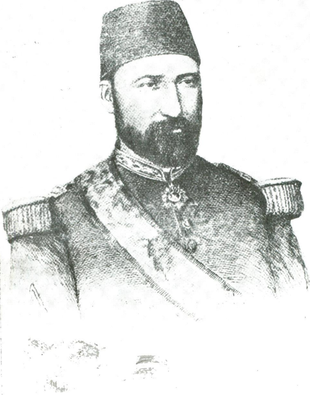
Res. 1 — Süleyman Hüsnü Paşa.