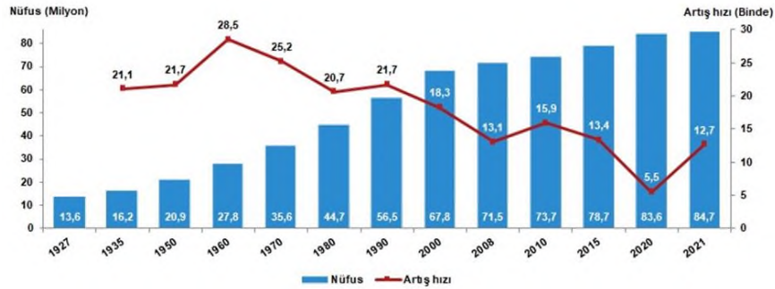
Şekil 2. Yıllık Nüfus Artış Hızı (TÜİK 2023c).

Şekil 2'e bakıldığında 1927 ve 2021 yılları arasında yıllık nüfus artış hızının değişimini göstermektedir. Buna göre en yüksek yıllık nüfus artışı 1960 yılında olurken (%28,5) en düşük artış ise 2020 yılında (%5,5) olmuştur. 1927-1960 arası nüfus artış hızının yüksek olması o dönemde uygulanan pronatalist uygulamaların bir sonucudur. 1960 sonrası görülen düşüş de nüfus planlanmasına bağlı olarak yürütülen anti natalist politikaların bir sonucudur.