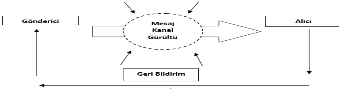
Şekil 1: İletişim Unsurları