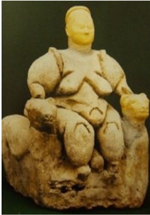
Şekil 3. Leoparlı Tahtında Oturan Ana Tanrıça (Belli, 2001: 5).