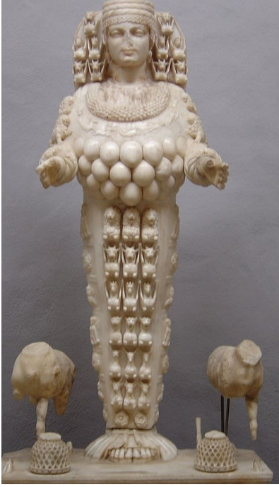
Şekil 4. Efes Artemis Tanrıça(Belli, 2001: 41).

Bazı araştırmacılara göre Ana Tanrıça kültü kimi zaman Yahve'nin eşi olarak "Astarte", kimi zaman "Shekhinah", kimi zaman da "Hikmet" (sofia) gibi farklı tecessümlerde canlılığını korumuştur. Halikarnas Balıkçısı bu hususla ilgili olarak İslamiyetin merkezî ibadethanesi denilebilecek Kâbe'nin adının Hübel'den, Kible'nin de Kibele'den geldiğini ifade etmiştir (Halikarnas Balıkçısı, 1995: 111).