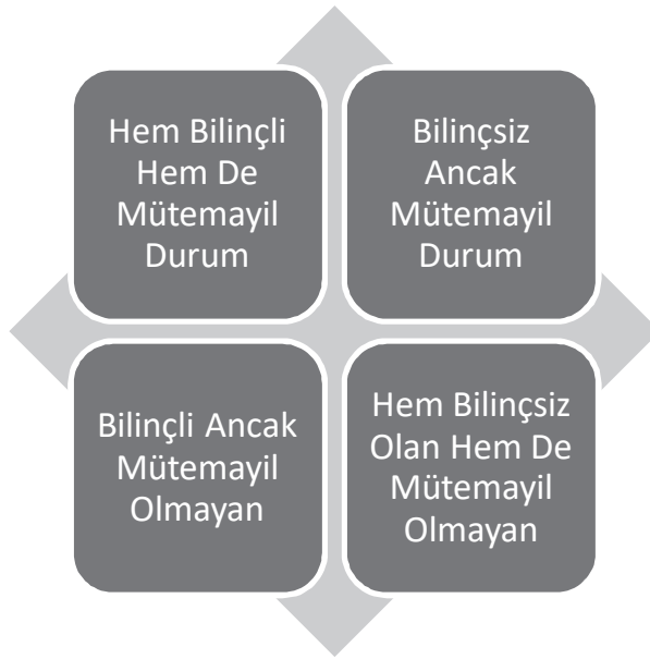
Şekil-1. Mütemayil Durum Türleri

İnsanın günün uyanık olduğu bölümünde bazı temayülleri bilinçlidir. Örneğin; insan aç veya susamış olduğunun bilincindedir. Ancak çoğu zihinsel durum bilinçsiz işlemektedir. Searle'nin verdiği başka bir örnekte: üzerinde düşünmeden George Washington'un İlk ABD başkanı olduğunu bildiğini -"inandığını"-, uyurken dahi bu durumun devam ettiğini bildirmiştir. Dolayısıyla temayül, mütemayil olmama, bilinçlilik ve bilinçsizlik durumları birbiriyle kesişmekte, ortaya şu şekilde dört farklı olasılık çıkmaktadır (Searle, 2010: 26):