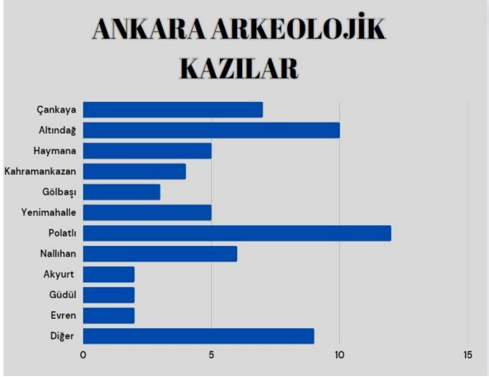
Resim 2: Ankara Arkeolojik Kazılar Grafiği