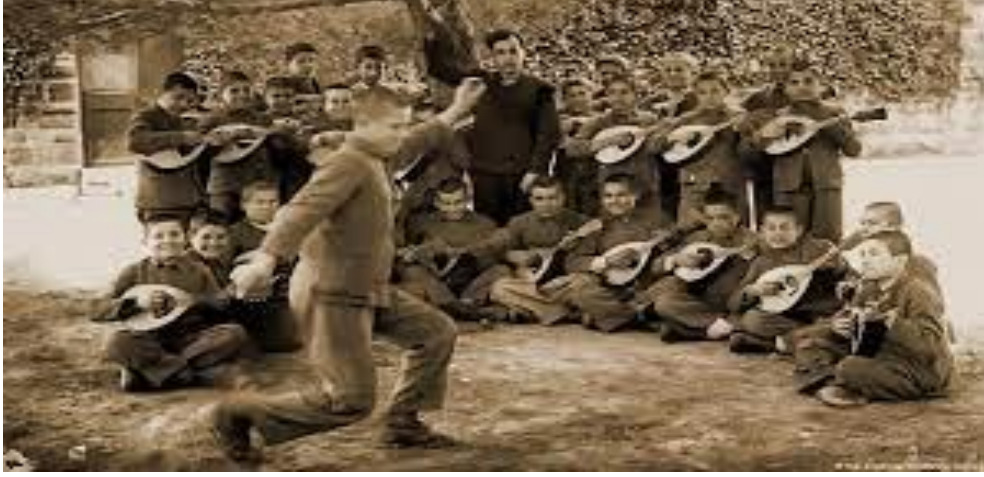
Fot. 1- İnternette ( https://egitimkolektifi.com/80-yilinda-koy-enstituleri-deneyimin-klonlanmasi-mumkun-mu/ ) alınan bu fotoĖraftaki öĖrencilerden birinin Osman Topçu olması ihtimali yksektir.