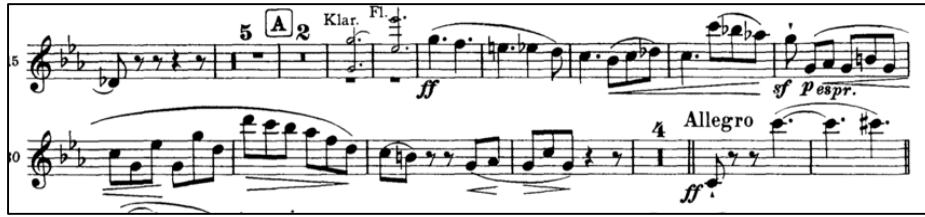
Şekil 2: Brahms 1. Senfoni 1. Bölüm 29-33. ölçüler 8

sakinleşerek çalınmalıdır. 12. Ölçüdeki eklenti tema aynı derecede piyano çalınacağından sol sesine dikkat edilmeli bu küçük motifteki crescendo ifadeli ve belirgin olmalıdır. Tuner ya da başka bir enstrümandan (fagot) devamlı sol sesi sağlanarak solo yavaş bir şekilde sol sesi ile birlikte çalışılabilir, bu çalışmanın doğru entonasyona faydası olacaktır.