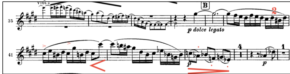
Şekil 7: Brahms 1. Senfoni 2. Bölüm 38-43. ölçüler 13

38-43. ölçüler arasındaki obua solo yalnız icra edildiği zaman zorluk farkedilmese de, orkestrada ile icra edildiğinde 40. ölçüden itibaren yaylı sazların senkop ritmleri üzerine çalındığından çalım zorluğu ile karşılaşılabilir. Canlı performansta şef dikkatle takip edilmelidir.