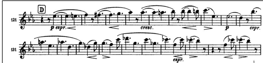
Şekil 3: Brahms 1. Senfoni 1. Bölüm 131-138. ölçüler 9

Birinci bölümün Allegrosunda, 130. ve 138. ölçüler arasındaki obua solo kromatik olarak inen aralıklardan oluşmaktadır. Tizlerdeki kısa sesler (si, si bemol, la) uzun seslere (mi bemol, re, re bemol) bağlanmaktadır. Entonasyona dikkat edilmeli, alt notalara bağlantıda diyafram ile desteklenmeli, inişlerde seslerin pes olmamasına ve kopmadan bağlanmasına dikkat edilmelidir. Çok yavaş çalışılmalı, parmaklar perdelere yumuşak hareketlerle bağlanmalı ve bu çalışmayı yaparken vibrato yapılmamalıdır. Vibratonun kullanılmaması seslerin birbirine karşı dengeli olmasını ve diyaframdaki hassasiyetin daha bilinçli olmasını sağlayacaktır.