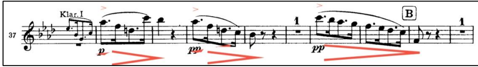
Şekil 8: Brahms 1. Senfoni 3. Bölüm 38-46. ölçüler 14

Bu bölümde icracıyı zorlayacak seviyede solo yok denebilir. Dikkat edilmesi gereken 38-41. ölçüler arasındaki solo 130. ölçüde paralel biçimde tekrarlanır. Solo başlangıcı daha ağırlıklı, yoğun hava vererek, vibratolu düşünülebilir. Noktalı sekizlik notalar ifade bozulmadan çok ritmik olmalı, bütünlük bozulmamalıdır.