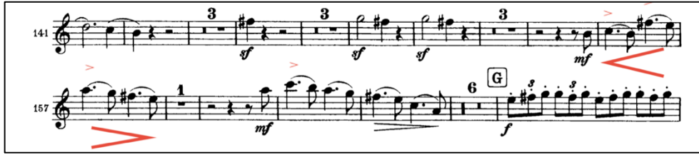
Şekil 10: Brahms 1. Senfoni 4. Bölüm 155-161. ölçüler 16

155-161. ölçüler de bir önceki solonun sanki çeşitlenmiş şeklidir. Noktalı 4'lükler ritminde ve ağırlık verircesine çalınmalıdır. Yükselen tize giden seslerde crescendo ve alçalan pese doğru giden seslerde tam tersi yapılabilir. Tema kısada olsa en küçük detaya özen gösterilmelidir.