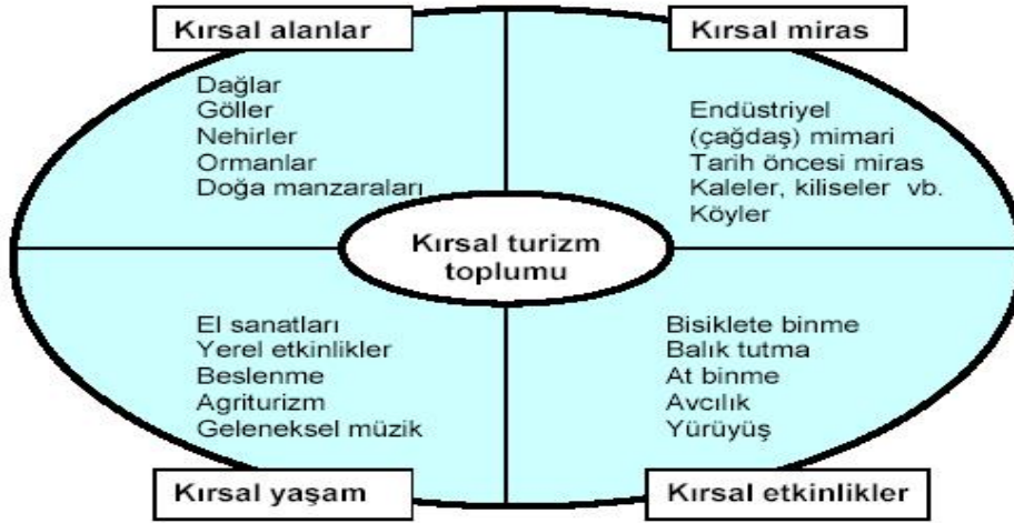
Şekil 1- Kırsal turizm kavramı (kırsal turizm bileşenleri) (Kaynak: Cabrini, 2004).

Kırsal turizmi, bir kavram olarak algılayabilmek için onun bileşenleri tanımlanmalıdır ve aşağıdaki şema bunu açıklamaktadır (Şekil: 1):