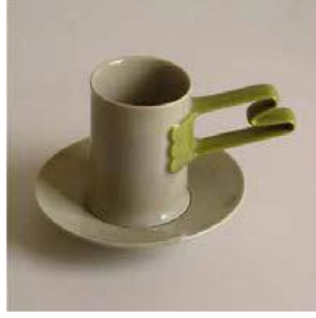
Görsel 10. Güngör Güner, Türk Kahvesi Fincanı (Özgüven, ty, s.136)

2017 yılında Uluslararası düzeyde düzenlenen “A’Design Award” tasarım yarışmasında, Görsel 10’ yer alan Türk Kahvesi Fincanı isimli eseri ile Gold Award prestij ödülünü kazanan sanatçı, çalışmasını dijital ortamda tasarlayarak, CNC tezgahlarında ürettiğini, fincanda bulunan bulutun Osmanlı kültürünü, geometrik biçimli kulpun Selçuklu kültürünü, fincanın silindirik formu ise iki kültürü bugüne aktaran Cumhuriyeti simgelediğini ifade etmiştir (Özgüven, ty, s.136).