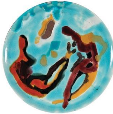
Görsel 2. İsmail, Hakkı Oygur, Abstract Seramik Tabak, 1956, çap: 26 cm (Arthill, 2023)

1962 yılında birçok yurt dışı sergi organizasyonunda seçici kurulda yer alan sanatçı, 1963 yılında Venedik'te III. Türk Sanatı Kongresi dolayısıyla Tarihi Türk Sanatı ve Çağdaş Türk Seramik Sanatı sergilerini düzenlemiştir. Uluslararası Seramik Akademisi'ne (IAC) üye olan ilk Türk sanatçı olarak, 1967 yılında IAC'ın geleneksel sergisinin ve genel kurulunun İstanbul Güzel Sanatlar Akademisi'nde yapılmasını sağlayan Oygur, aynı zamanda bu sergide altın madalya kazanmıştır (İsmail Hakkı Oygur, ty).