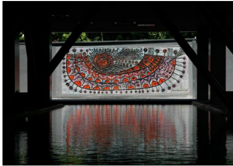
Görsel 8. Jale Yılmazbaşar, 1969, Vakko Binası (Gün 2017)