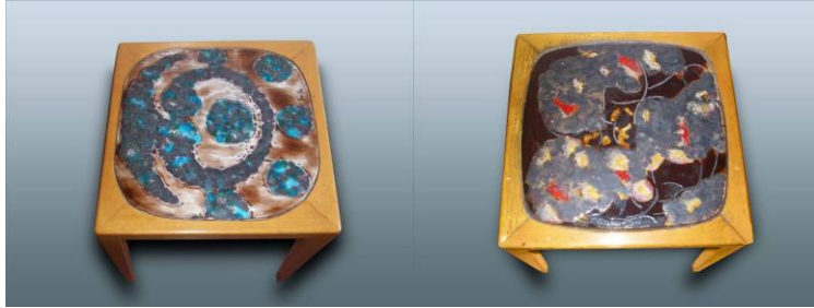
Görsel 3. Füreyâ Koral İmzalı Seramik Sehpa (Sevim ve Yeşilmen, 2017, s.132)

Füreyâ Koral, atölyesinde yetiştirdiği öğrenciler ile birlikte Türkiye Büyük Millet Meclisi'nde kullanılması için 1963 yılında sehpa (iki yüz on tane) yapmıştır. Füreyâ Koral, Cevdet Altuğ, İsmail Hakkı Oygur, Seniye Fenmen Taylan, Nasip İyem, Bingül Başarır, Atilla Galatalı ve Erdoğan Ersen gibi isimlerin imzaları sehpalarda bulunmaktadır. Seramik sehpa 1960-1969 yılları arasında yapılmış ve milletin temsil edildiği bir makamda kullanıma sunulmuştur. 1961-2013 yılları arasında kullanılan seramik sehpa, daha sonra restore edilerek arşive kaldırılmıştır (Sevim ve Yeşilmen, 2017, s.130).