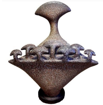
Görsel 5. Sadi Diren, seramik heykel, 45x36x26 cm (Uxmuzayede, 2021)

Sadi Diren, Almanya'da edindiği deneyimler ile özgün bir üslup oluşturur. Çalışmalarında Anadolu kültüründen etkilendiği formları soyutlayarak ve soyutladığı formları farklı versiyonları ile özgün bir ifade ile ortaya koyar. Sadi Diren, Anadolu kültüründen etkilendiği boğa, ana tanrıça figürü ve Hitit uygarlığının biçim anlayışını, kendi sanatsal değerleri ile birleştirerek özgün heykeller yaratmıştır. Formlarında yalınlığa önem verdiği görülen sanatçının seçtiği seramik çamurları ve sırları, kullandığı renklerde de görülmektedir. Çalışmalarında parlak canlı renklerden çok toprağın doğal renklerini tercih eder (Köse Bölük, 2019, s.21).