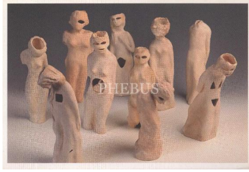
Görsel 4. Yürüyen İnsanlar, Füreyâ Koral (Büyükkaragöz ve Yayan, 2019, s.83)