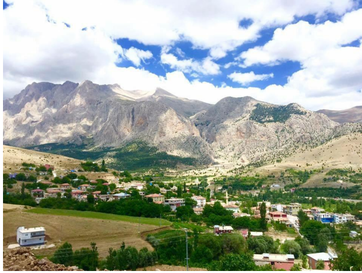
Foto 4. Çamardı İlçesinden Bir Görünüm 6

Dağlık alanlar, su kaynakları, yaylalar, tarihi ve kültürel mekânlar/yapılar ile ilçenin zengin turizm potansiyeline sahip olduğu söylenebilir (Şekil 3).