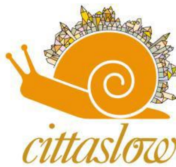
Şekil 1. Sakin Şehir Hareketinin Logosu

Chianti, Orvieto, Bra ve Positano kentlerinin belediye başkanları ve Yavaş yemek hareketinin kurucusu Carlo Petrini tarafından imzalanan sözleşmeyle Yavaş şehir hareketi, 15 Ekim 1999 tarihinde İtalya'nın Orvieto şehrinde resmen kurulmuştur. Birliğin logosu turuncu renkli bir salyangozdur. Yavaşlığın ve kalıcılığın simgesi olması nedeniyle kullanılan salyangoz simgesi aynı zamanda “Slowfood/Yavaş Yemek” hareketinin de simgesidir. Bu simge ile vurgulanan anlam, yavaş ve ama nitelikli bir ilerlemedir. Salyangoz kabuğu üzerinde yer alan şehirsal doku, geçmişi ve günümüzü sembolize etmektedir (Karakaş Özür, 2016: 160). Salyangozun sırtında bulunan saat kulesi ise geçmişten gelen miras ya da işaretler olarak değerlendirilebilir. Bu şekilde Cittaslow'un geçmişe dair bir kimlik taşıdığı mesajı verilmek istenmiştir (Şahin, 2017: 11). Salyangozun yaradılışı gereği kendi evini sırtında taşıması ve logoda sırtına kondurulan çeşitli yapıların bulunması, Cittaslow unvanı taşıyan kentleri tatil yeri olarak seçen konukların kendilerini evlerinde hissedecekleri ve konakladıkları yerlerde kendi evlerindeki gibi huzurlu ve sakin zaman geçireceklerini ifade etmektedir. Slowfood hareketinin kurucusu olan Carlo Petrini, Cittaslow unvanına sahip kentler için: “Bu şehirler huzurlu ve sağlıklı yaşam alanları gibidir” ifadesini kullanmıştır (Ionel, 2012: 3). Yavaş şehirlerde geniş yeşil alanlar, ağır sanayiden yoksunluk ve geri dönüşüm hareketlerinin ön planda tutulması bu ifadeyi desteklemektedir.