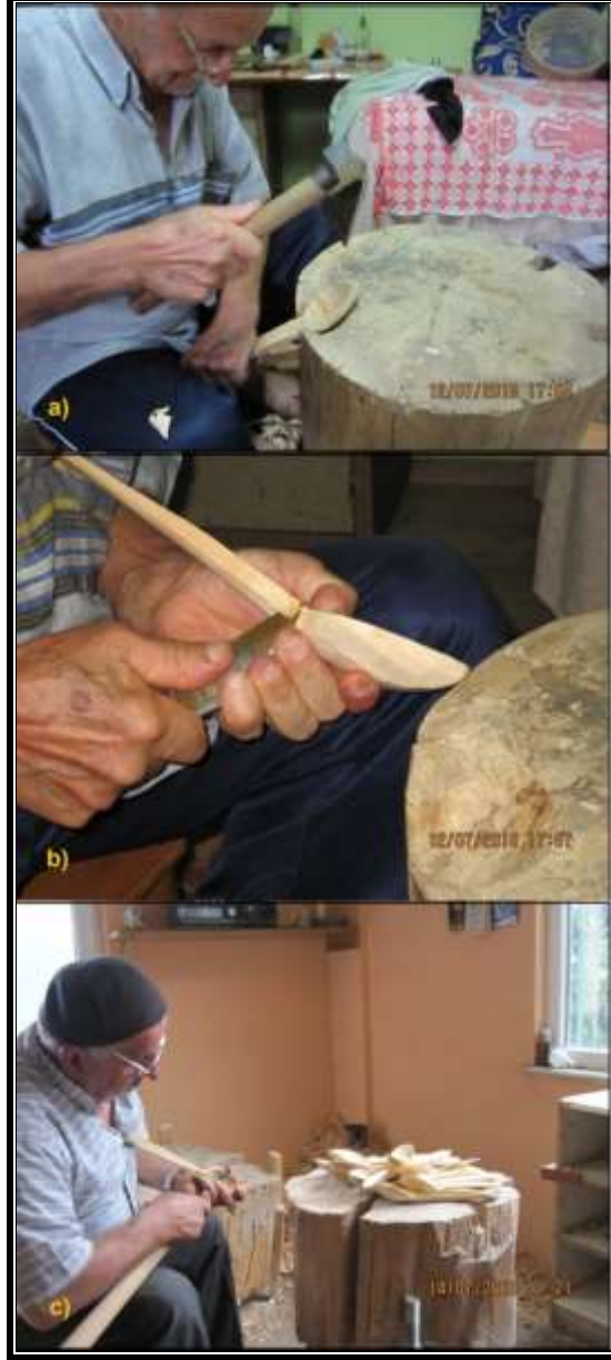
Fotoğraf 3. Kaşık imalatının aşamalarından: a) Keserle taslak halindeki kaşığın ağız kısmının oyulması, b) Özel ahşap bıçakla sapının düzeltilmesi, c) Eđdi denilen bıçakla kaşığın içinin pürüzsüz hale getirilmesi