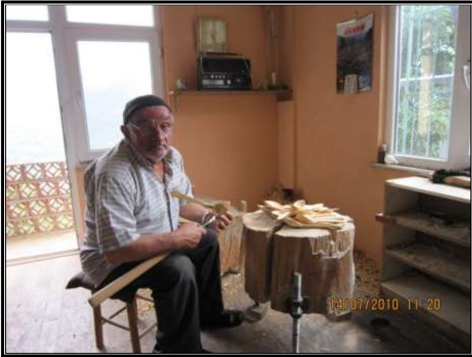
Fotoğraf 2. Köprübaşında tahta kaşık imalatı evin bir odasında ya da alt katında yapılmaktadır.

Genellikle tek kişinin çalıştığı bu ekonomik faaliyette üretim evin içinde ya da alt katındaki bir odada yapılmaktadır (Fotoğraf 2.).