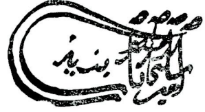
Res. 2— Emir Süleyman'ın yeni bulunan tuğrası. (Fatih Kü. No. 1356. Üzerinden dikkatle kopye edilmiştir).