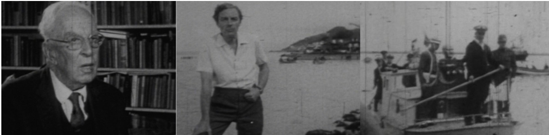
Türklerin Babası Atatürk II filminden planlar