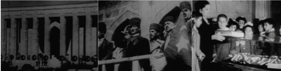
Türklerin Babası Atatürk I filminden planlar