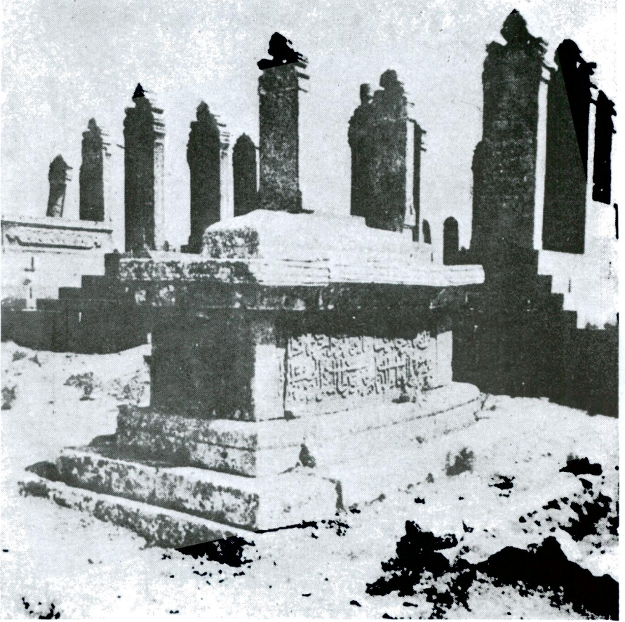
Res. 3 — Makam-ı İbrahim mezarlığı.