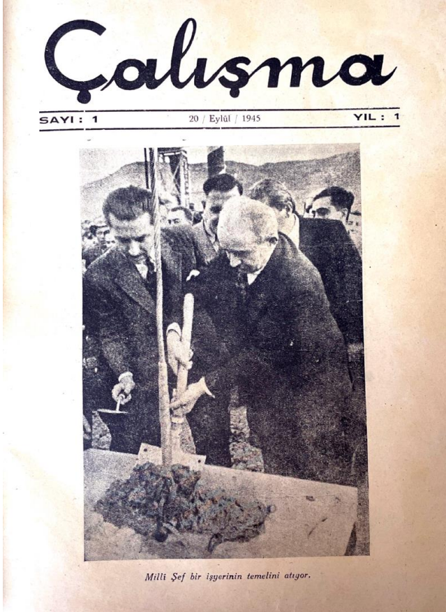
Görsel 4: Çalışma dergisinin ilk sayısının iç kapağında Cumhurbaşkanı İsmet İnönü

Çalışma dergisinin kısıtı ve önemini şöyle özetlemek mümkündür. Dergi Türkiye’de sosyal politikanın kurucu külliyyatının önemli bir parçası ve rejimin sosyal politika fikriyatının organı sosyal politika meselelerinin tartışma zeminidir. Ancak Çalışma dergisi bir yandan rejimin ve CHP’nin sosyal politika yaklaşımının sınırları ile maluldür. Çalışma , rejimin sosyal politika dergisidir. Bireysel işçi haklarında koruyucu paternalist bir yaklaşıma sahiptir. Grev ve sendika meselesinde ise otoriter yaklaşımlara sahiptir. Bu haliyle Çalışma dergisi tıpkı Makal’ın (1999) 1936 İş Kanunu’nu tanımlarken vurguladığı gibi bireysel iş ilişkileri açısından “koruyucu”, toplu iş ilişkileri açısından ise “otoriter” bir nitelik taşıyan ikili karakterine benzemektedir. Gülmez’in (1995) ifadesiyle 3008 nasıl rejimin İş Yasası ise Çalışma da rejimin dergisidir.