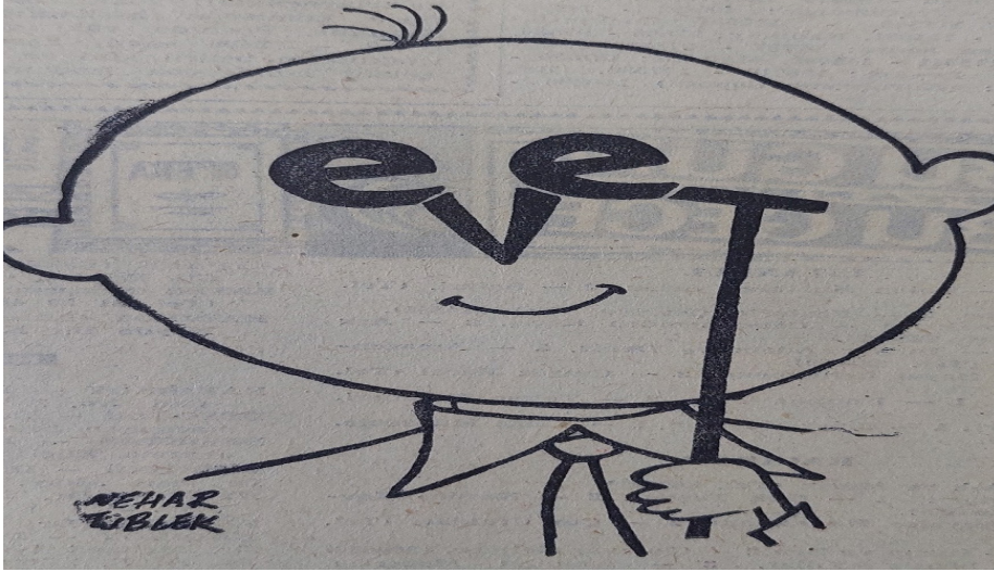
Karikatür 3: 11 Temmuz 1961-Akşam