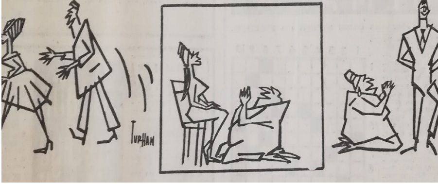
Karikatür 2: 4 Temmuz 1961-Milliyet

diğer gazetelerde de “Evet” oyu vurgusu sıklıkla yapılarak manşetten verilmiştir. 72 Ayrıca Gürsel’in konuşmalarına da atıfta bulunularak, “Normal nizama bir an önce varmak için herkesin beyaz oy vermesi şart” çağrısının oy pusulasındaki renklere de işaret ettiği belirtilmektedir. 73 1961 Referandumu’nda beyaz pusula “Evet” oyunu kırmızı pusula ise “Hayır” oyunu belirten iki renkle kategorize edilmiştir.