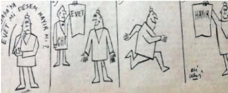
Karikatür 4: 11 Temmuz 1961-Cumhuriyet