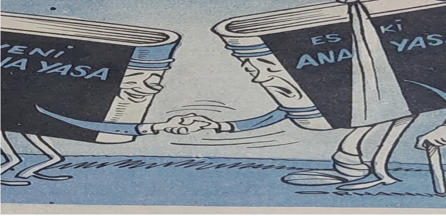
Karikatür 6: 10 Nisan 1961- Karikatür Mecmuası

1961 Anayasası geçmişten alınan dersler sonucunda kurulmak istenen yeni bir düzenin başlangıcı olarak değerlendirilebilir. Yeni anayasa için önceki dönemde yaşanan tecrübeler ders niteliğinde kabul edilmiş ve 1924 Anayasası'nın boşlukları yani eksik yönleri giderilmeye çalışılmıştır. Böylelikle "tepki Anayasası" 111 olarak nitelendirilen 1961 Anayasası ile yeni bir döneme girilmiştir. Türk demokrasi tarihindeki gelişim basamaklarından biri olan 1961 Anayasası özgürlük, demokrasi ve insan hakları ilkelerinin yanı sıra sosyal devlet anlayışı, kişi hak ve hürriyeti gibi birçok kavramı içinde barındıran bir anayasa olarak tarihe geçmiştir.