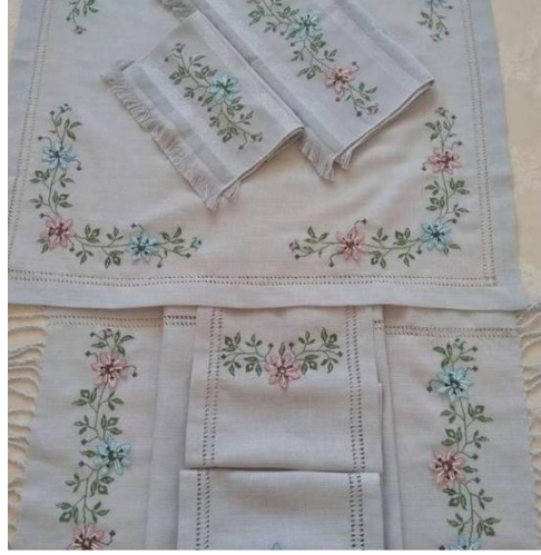
Fotoğraf 31-32 (KK-2). İğne Oyalarının Ev Tekstilinde Kullanımı (Yıldız, 2023)