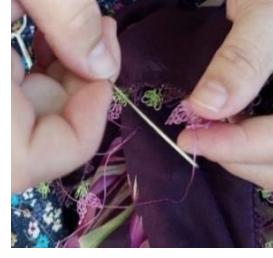
Fotoğraf 5-6-7 İğne Oyalarında Kullanılan Malzeme ve Yapımı (Yıldız, 2023)