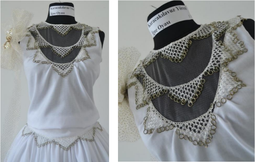
Şekil 4 Tasarım Dilber Yıldız

İğne oyasının adı dağlar motifidir. Beyaz sentetik iplik kullanılmıştır. Tığ ile yapılan tırabzan tekniğinin üzerine uzun sıçan dişi ve yedili başlanılan dağlar bire düşürülerek işlenmiştir. Aksesuar olarak metal halkalar kullanılmıştır. Dekoratif bezeme kullanılmıştır. Gelinlik kumaşı yöredeki iğne oylarının yapıldığı beyaz bezdir.