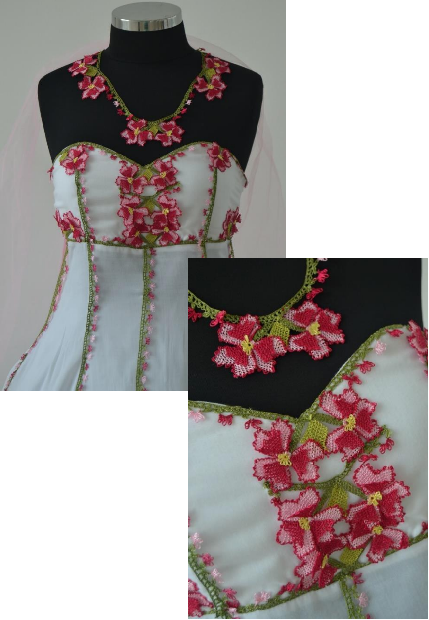
Şekil 2 Tasarım Dilber Yıldız

İğne oyasının adı kalp çiçeği motifidir. (Sevgi ve aşkı simgelemektedir). Gül kurusu, pembe, yeşil sentetik iplik kullanılmıştır. Bitkisel bezeme uygulanmıştır. Tığ ile yapılan tırabzan tekniğinin üzerine iğne oyası yapılmıştır. Ana motifte altılı yaprak üzerine üçlü kalp çiçeği motifi, aralarda üçlü püpcuk işlenmiştir. Oya gelinlik süslemesinde ve takı yapımında kullanılmıştır. Gelinlik kumaşı yöredeki iğne oyarının yapıldığı beyaz bezdir.