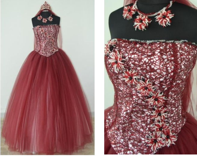
Şekil 3 Tasarım Dilber Yıldız

İğne oyasının adı yıldız çiçeği motifidir. (Sabrı temsil etmektedir.) Kırmızı, beyaz sentetik iplik kullanılmıştır. Bitkisel bezeme uygulanmıştır. Yıldız çiçeğinden esinlenilerek yapılmıştır. Yörede indi bindi denilen püpcukların uzatılması ile oluşturulan motif işlenmiştir. Aksesuar olarak siyah boncuklar kullanılmıştır. Oya gelinlik süslemesinde ve takı yapımında kullanılmıştır. Gelinlik kumaşı yöredeki iğne oylarının yapıldığı beyaz bez ve renkli tülüdür.