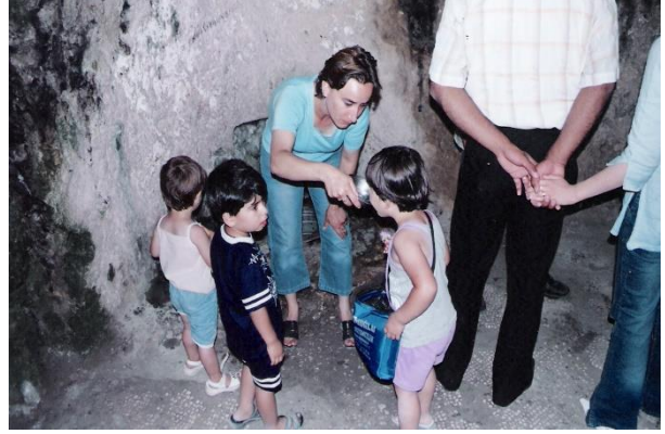
Kutsal su içirilen çocuk (St. Pierre Kilisesi/Antakya)