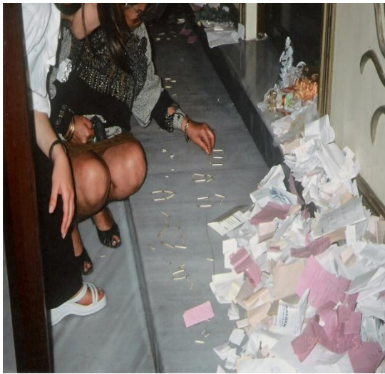
Mektup bırakarak ve şekil yaparak dilek dileyenler (St. Georges Kilisesi/ İskenderun)