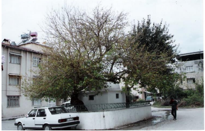
Kutsal Ağaç (Şeyh Muhammed el-Kadim/Sümerler)