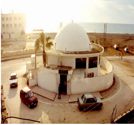
Türbenin etrafında arabayla dönenler (Hızır türbesi/ Samandağ)