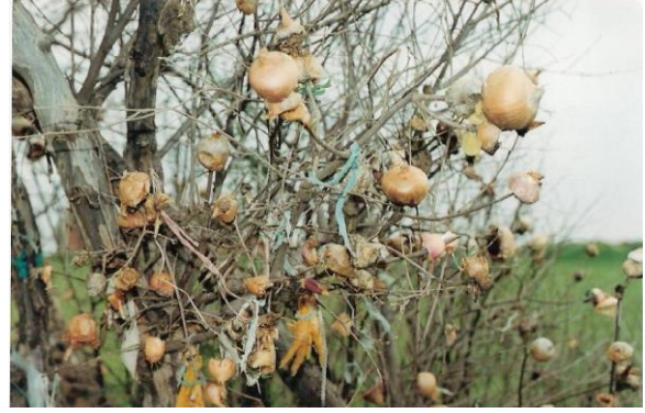
Dilek ağacı (Hızır/mengüllü)