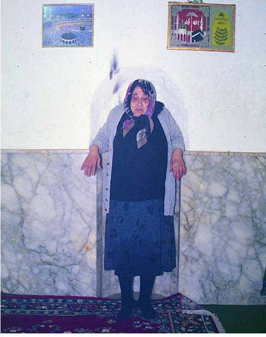
Ağrıyan sırtını duvara süren bir kadın (Hızır türbesi /Affan)/ Hatay