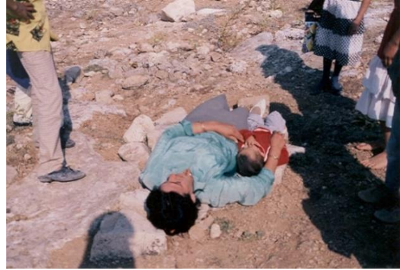
Hüseyin Gazi'nin atının ayak izinin olduğuna inanılan kayanın üzerine yatan kadın/Hüseyin Gazi Türbesi /Divriği /Sivas