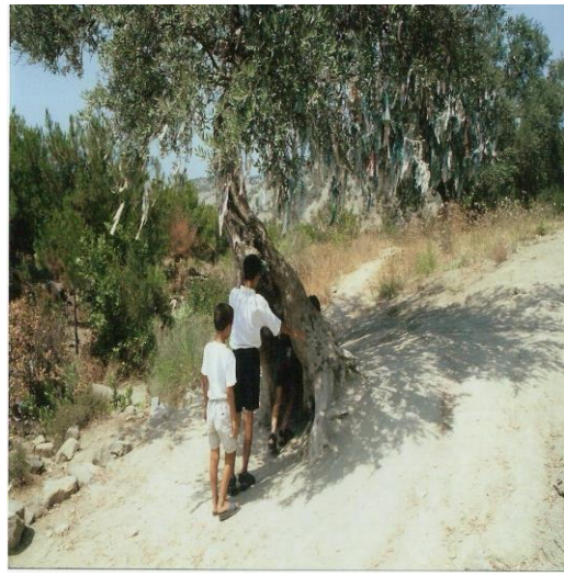
Dilek ağacının içinden geçen çocuklar (Hızır türbesi Hatunköy)