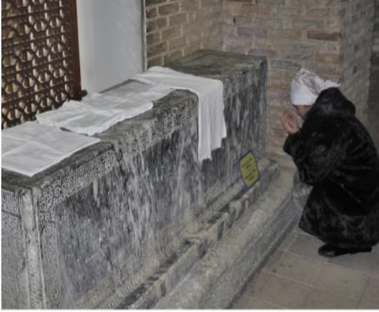
Hoca Ahmet Yesevi Türbesine beyaz bez getiren ve dua eden bir kadın.