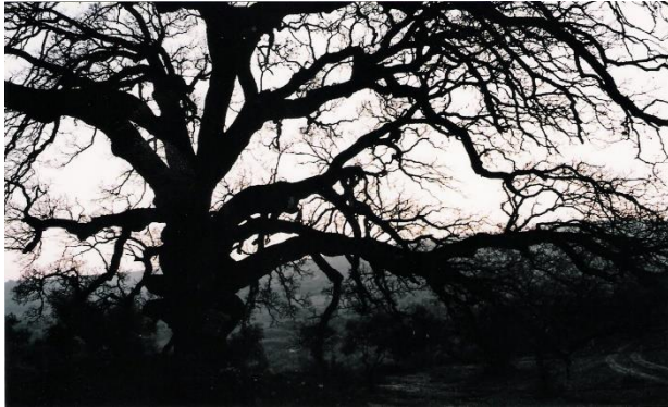
Sallanan ağaç (Sarbük/Altınözü) /Hatay