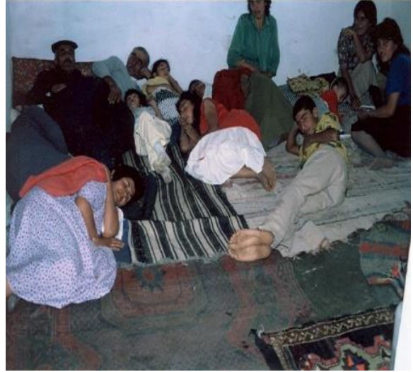
Türbede uyuyan ziyaretçiler (Hüseyin Gazi türbesi/Divriği)