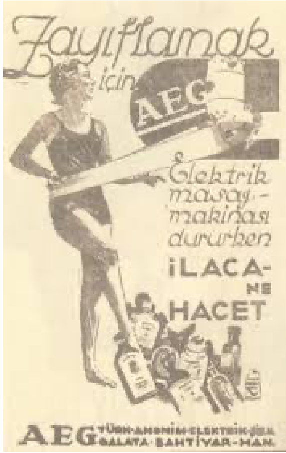
Görsel 7: AEG reklam afişi, İhap Hulusi Görey, 1930'lar

İhap Hulusi Görey'in 1920'li yıllarda AEG firması için tasarladığı bu zayıflama makinası afişinde mayolu genç bir kadın görülmektedir. Afişin sağ alt köşesinde artık gereksinimi kalmayan bazı zayıflatma hapları bulunmaktadır. Cumhuriyet dönemi modernleşmesinde bu afişte olduğu gibi ideal bedene yapılan vurgu sık sık göze çarpar. Cumhuriyet kadınları genç, dinamik, bedenine önem veren kadınlar olarak resmedilmektedir. Ancak bu seslenilen kadın imgesi o dönemin toplum koşullarında İstanbul'da bulunan küçük bir azınlığı temsil etmektedir.