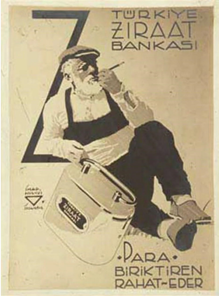
Görsel 15: Ziraat Bankası çiftçi reklamı, İhap Hulusi Görey

Ziraat Bankası'nın afişinde yaşlı, sakallı, kasketli bir köylü yere uzanmış, yanında bir kumbara ile keyifle sigarasını içerken betimlenmiştir. Afişte, Ziraat Bankası yazısı ile birlikte "Para biriktiren rahat eder" yazılıdır. Böylece, paranın bankada biriktirilmesi gerektiği mesajı verilmekte, bankacılık işlemlerine güvenmesi, tanıdık olması sağlanmaya çalışılmaktadır. 1929 Büyük Ekonomik Buhranı'yla aynı yıl, ithalatı kısıtlayıp yerli üretimi özendirmek amacıyla kurulan Millî İktisat ve Tasarruf Cemiyeti'nin, amaçlarından bir de yine halkı tutumlu yaşamaya alıştırmak ve tasarruf alışkanlığı kazandırmaktır. Cumhuriyet'in ilk yıllarında kurulan Ziraat Bankası ise tarım sektöründe motor işlevi görmüştür. Bu bağlamda bu afiş hem bankanın reklamını yapmakta