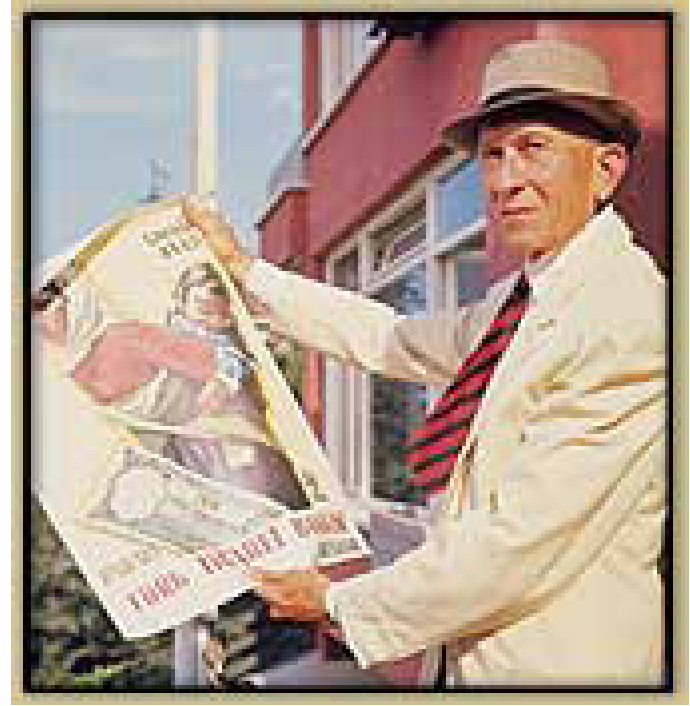
Görsel 4: İlk alfabe kitabı kapağı, İhap Hulusi Görey, 1932