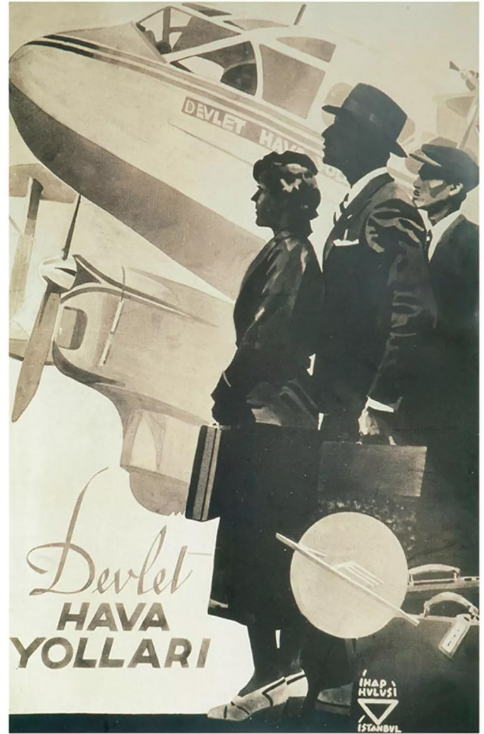
Görsel 8: Devlet Hava Yolları reklam afişi, İhap Hulusi Görey

Türkiye Cumhuriyeti, kuruluşunun 1930'lu yılların başında, planlı ekonomi ve devletçilik politikasına geçiş yaptı. Bu politikanın sürdürüldüğü cumhuriyet yıllarında devlet tarafından kurulan önemli kurumlar bulunmaktadır. Bunlardan bazıları Devlet Demiryolları, Denizyolları, Sümerbank, İhisarlar İdaresi (Tekel), Kızılay, Türk Hava Kurumu, Çocuk Esirgeme Kurumlarıdır. Bu kurumların geniş kitlelere duyurulması açısından grafik tasarımları önemli bir rol oynamaktadır. İhap Hulusi'nin yaptığı afişinde gördüğümüz 20 Mayıs 1933 tarihinde kurulan ve ilk adı "Hava Yolları Devlet İşletme İdaresi" (günümüzde Türk Hava Yolları) bu kurumlardan birisidir.