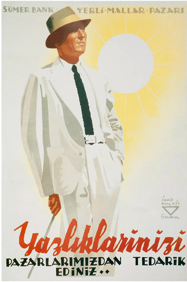
Görsel 13: Sümerbank reklam afişi, İhap Hulusi Görey

İhap Hulusi Görey'in bir diğer çalışması da Sümerbank için hazırladığı reklam afişidir. Devlet desteğiyle açılan Sümerbank fabrikası için halkın yerli mallara özendirilmesi sağlanmaya çalışılmaktadır. 1925 yılında gerçekleştirilen şapka ve kıyafet inkılabıyla Türk toplumu biçimsel anlamda bir Batılılaşma yaşadı. Afişte şapkalı, takım elbiseli, kravatlı elinde bastonuyla Batılı bir görüntü sunan erkek figür bastonuyla betimlenmektedir. Burada verilen mesaj, şehirli bir erkeğin şık ve bakımlı olmasının yanında, aynı zamanda vücut dilinden de anlaşılacağı üzere zarif olması gerektiğidir. O dönemin koşullarına bakıldığında bu tarz bir figürü ancak İstanbul'un bile belirli bölgelerinde görmek mümkündür.