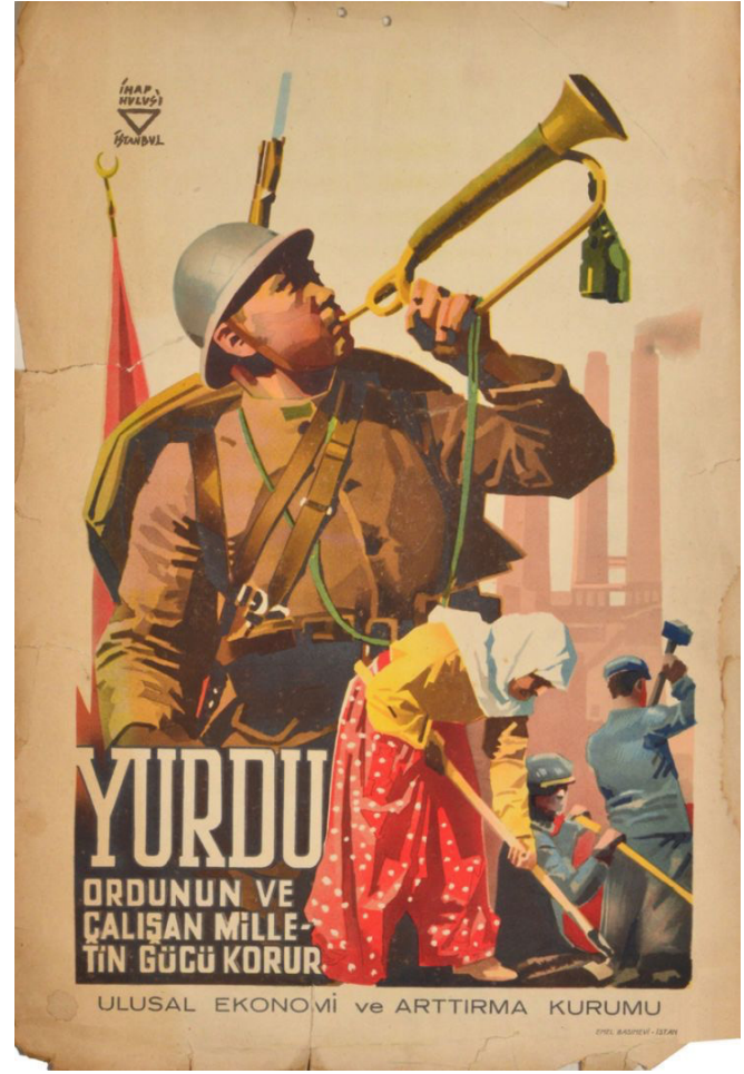
Görsel 14: Millet ve Ordu afişi, İhap Hulusi Görey

"Ulusal Ekonomi ve Arttırma Kurumu için tasarlanan bu afişte askeri güç, tarımsal güç ve sanayi gücü birlikte gösterilmektedir. Yurdun savunucuları ordu ve emekçi millettir mesajı verilmektedir. Bu bilinçle toplumun hareket etmesi gerektiği vurgulanmaktadır. Afişin sol ve en büyük alanını kaplayan asker figürü orduyu, önde çapa yapan köylü kadın tarımsal gücü, arkada ellerindeki iş aletleriyle çalışan erkekler emekçi gücü, sağ arka plandaki silüet şeklindeki bacalar sanayileşmeyi simgelemektedir. Dayanışma ve yurtseverlik vurgusu yapılarak ülkenin askeri gücünün arkasında halkın gücü ve emeği yatması gerektiği vurgusu yapılmaktadır" (Serin, 2006).