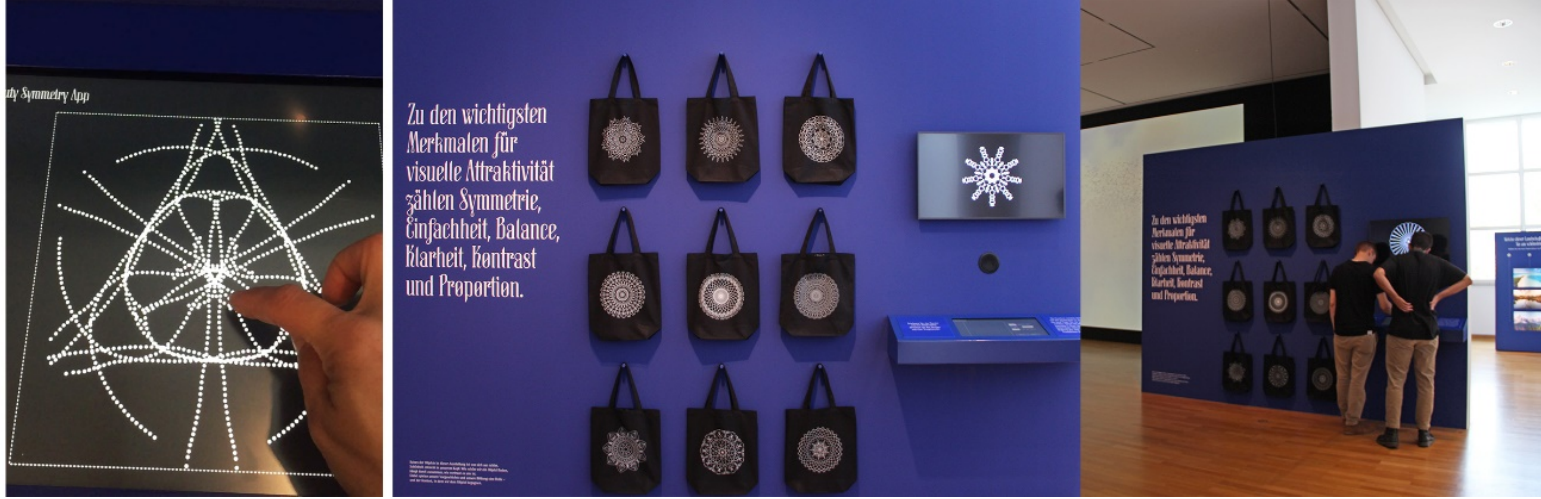
Görsel 6. Güzellik , yerleştirme 4'ten ayrıntılar, Museum Angewandte Kunst, 2019

Sergide simetri, sadelik, denge, netlik, kontrast ve orantı güzellikten sorumlu daha belirgin özellikler olarak belirtilmektedir. Simetri güzelliğin evrensel bir bileşenidir. Ziyaretçiler tarafından bu fikrin deneyimlenebilmesi için etkileşimli bir çizim platformu oluşturulmuştur (Görsel 6). Ziyaretçiler interaktif bir uygulama ile simetrik çizimler yapabilmekte ve daha sonra uygulama aracılığıyla üzerine beğendiği şeklin basılı olduğu bir çanta sipariş edebilmektedirler.