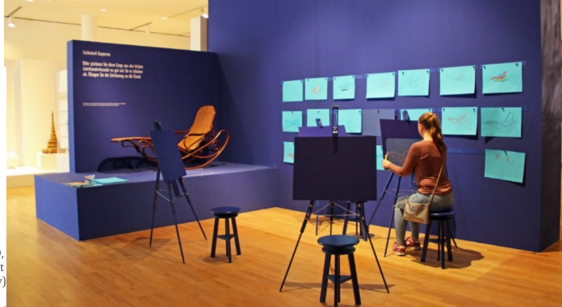
Görsel 15. Güzellik , yerleştirme 66, 2019, Museum Angewandt Kunst

Bu kısımda sergilenen ve bir dövme sanatçısının göğüs kanseri geçiren kadınların göğüslerine yaptığı dövmeler, sanatta sadece kusursuzluğuyla var olmuş bedenın artık kusurlu olana dönüştüğünü göstermektedir (Özyonar Çırak, 2022, s. 969). Farklı bedenlerin yara izleri ve kusurları kendilerine özel yaratılan dövmelerle güzelleşmektedir. Ayrıca domuz mesanesinden yapılan renkli toplar, İsveç tasarımcı Martin Woodtli'nin bir afişi tasarlarkenki uzun ve çetrefilli aşamaları bu alanda göze çarpan diğer sergilemelerdir. Bu bölümde ziyaretçilerin farklı şekillerde deneyimlediği sanat eserleri, izleyiciler üzerinde duygusal ve sosyal etki yaratabilmekte, yeni bakış açıları geliştirmelerine ve yaratıcı gelişimlerine katkıda bulunabilmektedir.