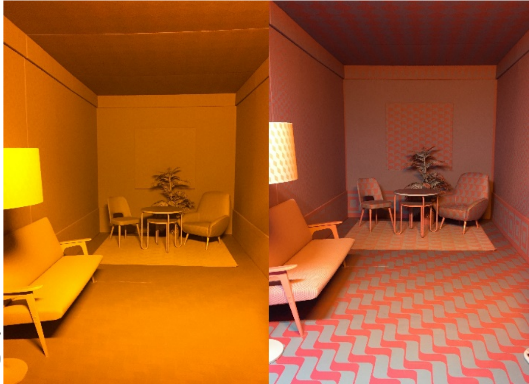
Görsel 11. Güzellik , yerleştirme 39, 2019, Museum Angewandt Kunst