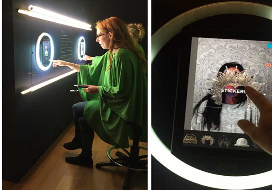
Görsel 13. Güzellik , yerleştirme 50'den ayrıntılar, 2019, Museum Angewandt Kunst

Bu kısımdaki son örnek ise, ziyaretçilerin tanınmış tasarımcıların çeşitli kıyafetlerini ve aksesuarlarını bir tablet aracılığıyla kendi üzerlerinde deneyebildikleri Yerleştirme 50'dir (Görsel 13). Bu yerleştirmede ziyaretçi, tabletin karşısında oturup giydiği yeşil bir pelerin ile fotoğraf çekmektedir. Daha sonra kendi fotoğrafını çeşitli etiket ve kıyafetlerle süslemektedir. Ziyaretçi son halini alan fotoğrafını kendi mail adresine gönderebilmektedir.