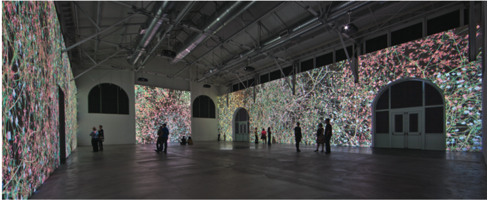
Görsel 1. Jennifer Steinkamp, Madame Curie , 2017, video yerleştirme (Artsy, t.y.)

Çağdaş sanat müzelerindeki güncel sergilemelerin önemli bir bölümünü yerleştirme sergilemeleri kapsamaktadır. Yaratıcı deneyim imkanı sunması ve izleyici etkileşiminin sanatın önemli bir bileşeni haline gelmesi sayesinde çağdaş sanatın en hızlı gelişen alanlarından biri olmuştur. 1960'lı yıllardan itibaren çağdaş sanat alanında izlenen mekan yaratımı, yerleştirme, mekana özgü gibi ifadelerle de tanımlanan yerleştirme sanatı, birçok