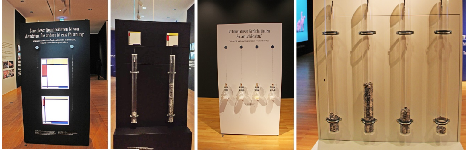
Görsel 10. Güzellik , yerleştirme 31 (solda) ve yerleştirme 43 (sağda) ayrıntıları, 2019, Museum Angewandt Kunst

Ziyaretçiler, güzelliği sorgulayan platformlarda verdikleri oylarla hem kendi farkındalıklarını arttırmakta hem de sergilemenin amacına ulaşmasını sağlamaktadır. Sonuç olarak ziyaretçiler ortak deneyimlere ulaşarak birbirlerine daha bağlı hissedebilmekte ve güzellik hakkında sohbet ederek fikirlerini paylaşabilmektedir.