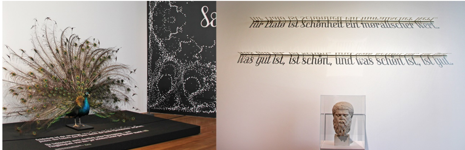
Görsel 5. Güzellik , yerleştirme 3 (solda) ve yerleştirme 14 (sağda) ayrıntıları, 2019, Museum Angewandte Kunst

İnsanların evrensel olarak güzel bulduklarını da test ettik. Güzelliğin bir kısmı içimizde yerleşiktir, ancak bir kısmı da eğitimimize, geçmişimize ve kişisel deneyimlerimize dayanır. Eğitim, güzel yaratıcı çalışmaların nasıl yapıldığını anlama becerisinde kesinlikle büyük bir rol oynayabilir. Ancak güzellik tek bir tarza özgü değildir. Güzel bir nesne Barok ve gösterişli, basit ve Modernist veya ikisinin arasında herhangi bir şey olabilir. Bize biraz aşına olduklarında, ama aynı zamanda bir yenilik unsuruna da sahip olduklarında, şeyleri güzel bulma eğilimindeyiz. Güzellik, onu gördüğümüzde ve deneyimlediğimizde hissettiğimiz duygusal bir tepki uyandırır. Güzel bulduğumuz şey, kısmen tüm insanlarda evrenseldir ve kısmen öğrenilmiş ve kültürel koşullanmadır. Tasarımcılar olarak, güzelliği ciddiye aldığımızda işimizin çok daha iyi çalıştığını gördük. Bulgularımızın tüm alanlardaki tasarımcılar, yaratıcılar ve yenilikçiler için muazzam değer taşıdığını ve şüphesiz kendi bakış açımızı ve güzele olan saygımızı değiştirdiğini ve işimize yeni bir derinlik kattığını düşünüyoruz. (Andwalsh, 2019)