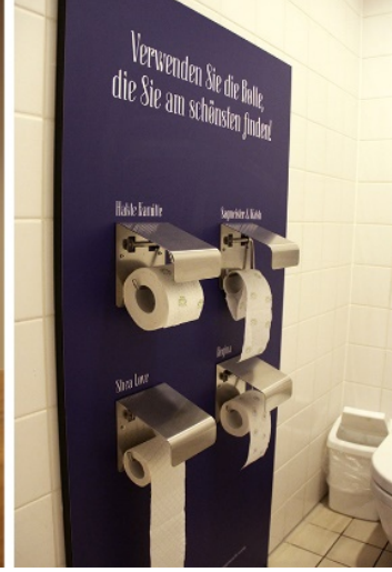
Görsel 14. Güzellik , yerleştirme 47 (solda) ve yerleştirme 68 (sağda) ayrıntıları, 2019, Museum Angewandt Kunst (Eda Uzun kişisel arşiv)