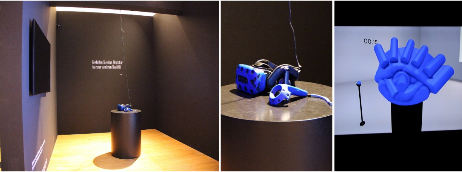
Görsel 12. Güzellik, yerleştirme 45'ten ayrıntılar, 2019, Museum Angewandt Kunst

Bu kısımdaki diğer ilginç yerleştirme ise sanal gerçeklikte üç boyutlu bir heykel yapmaya olanak sağlayan platformdur (Görsel 12). Platformda sanal gerçeklik başlığı takıldıktan sonra ziyaretçi kendisini üç boyutlu bir ortamda görmektedir. Bu ortam karşıda bulunan büyük boyutlu bir ekrana yansımaktadır. Ziyaretçi bu ortamda uzaktan kontrol edilen bir çizim kumandası ile kendi üç boyutlu heykelini yaratabilmektedir. Ziyaretçi içine girdiği sanal sergi mekanında ve yarattığı eserinin etrafında dolaşabilmektedir. Sanal gerçeklik başlığı çıkarıldıktan sonra ziyaretçi heykelini platformda bulunan ekrandan da görebilmektedir. Bu sayede bir özne olarak kendi estetik deneyimini yaratmaktadır.