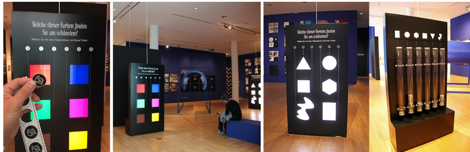
Görsel 9. Güzellik, yerleştirme 33 (solda) ve yerleştirme 34 (sağda) ayrıntıları, 2019, Museum Angewandt Kunst

Bu bölümde, ziyaretçinin hangi resmin Piet Mondrian'a ait bir kompozisyon hangisinin sahte olduğunu seçtiği Yerleştirme 31 dikkat çekmektedir (Görsel 10). Platformun arka tarafına jetonların çok olduğu tarafın gerçek resme ait olduğu görülmektedir. Diğer bir