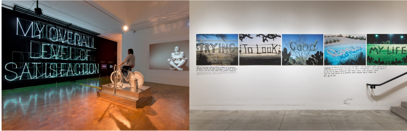
Görsel 4. Stegan Sagmeister, Mutlu Şov sergisinden görüntüler, 2013, Los Angeles Çağdaş Sanat Müzesi